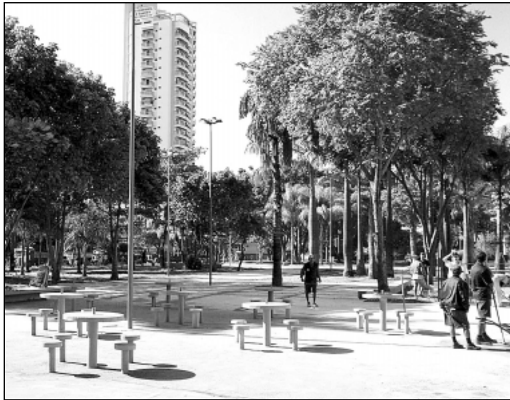
Reurbanização do espaço público proporcionará mais segurança e conforto à população

Os portadores de necessidades especiais também foram beneficiados pelas obras, reali-