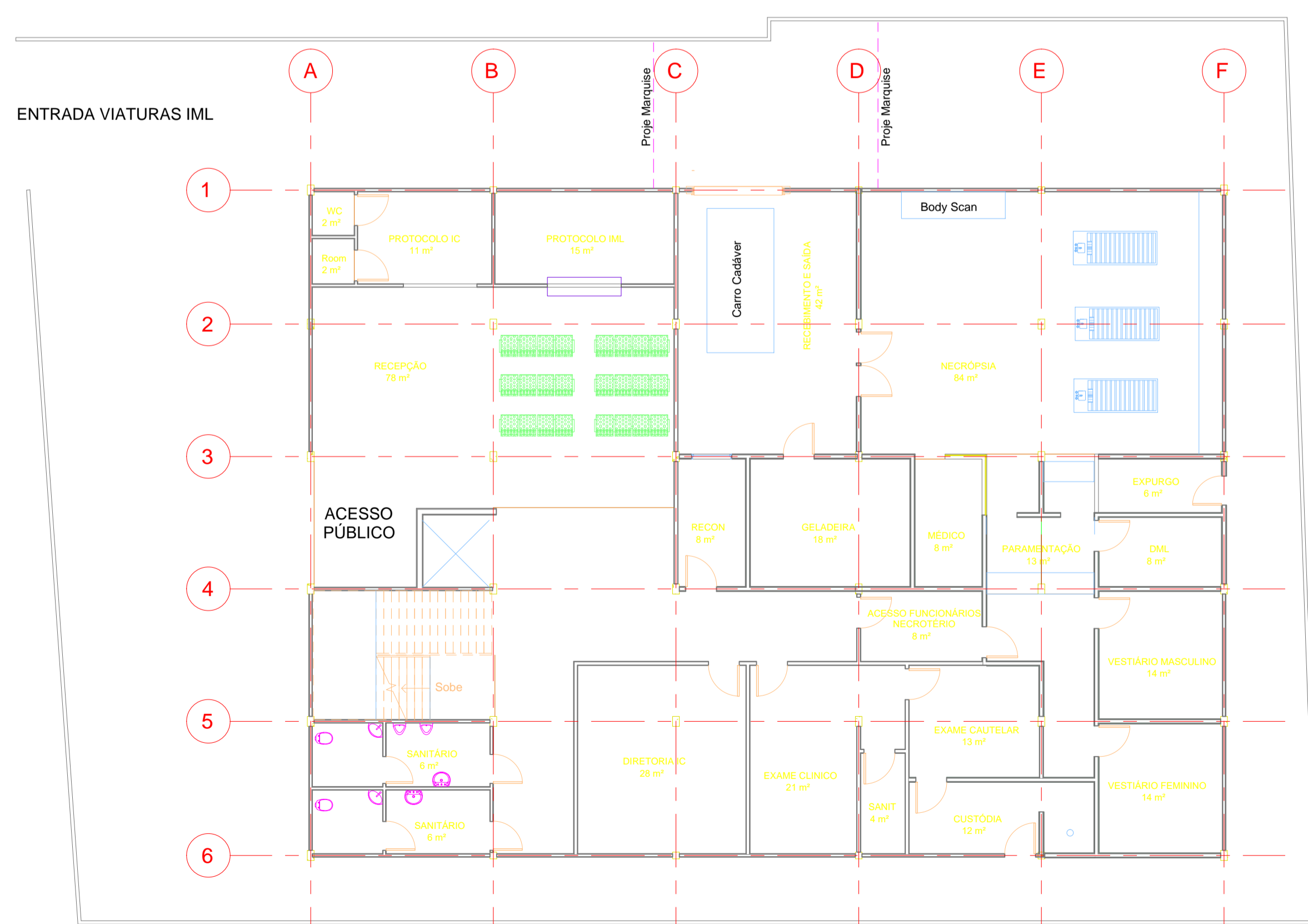
VISTA DE PLANTA PAVIMENTO TERREO (ESC. 1:125)

NOTAS: 1 - DIMENSÕES EM METROS. 2 - ENDEREÇO: RUA BERNARDO BROWNE, 122 - SANTOS - SP