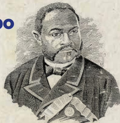
Quintino de Lacerda

Conta-se que o Quilombo do Jabaquara, liderado por Quintino de Lacerda, tinha um túnel secreto até o Porto de Santos, permitindo fugas rápidas. Moradores ainda relatam ruídos misteriosos no bairro.