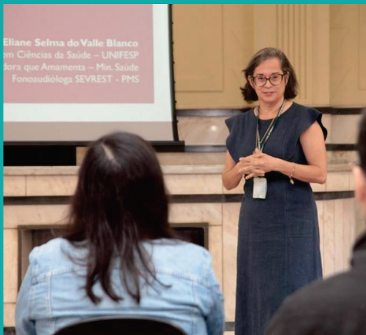
‘Mãe Trabalhadora que Amamenta’ no Paço Municipal, que integra a programação do Agosto Dourado da Capep-Saúde de Santos.