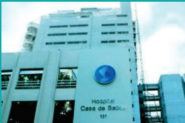
Agosto Dourado: Capep-Saúde de Santos promove palestra com profissionais de maternidade