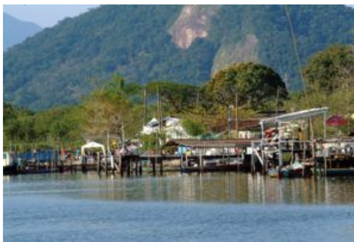
RIO DIANA, BAIRRO ILHA DIANA. ÁREA CONTINENTAL.