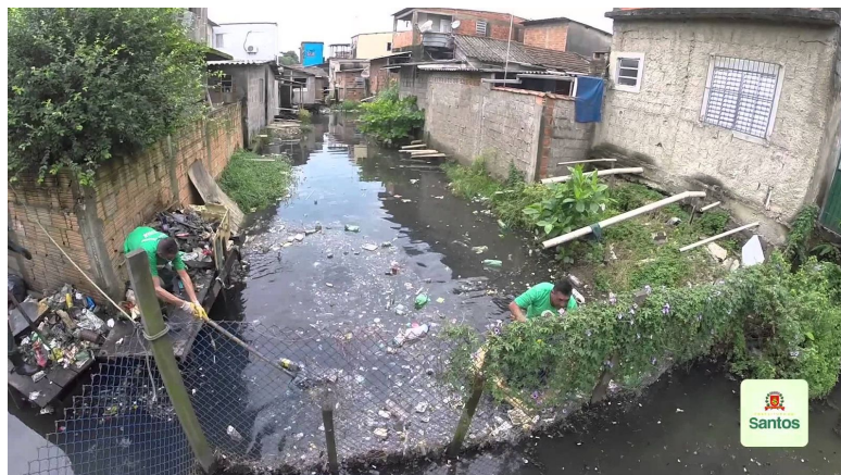
RIO SÃO JORGE, BAIRRO SÃO JORGE. ZONA NOROESTE.