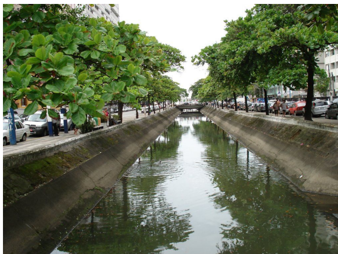
CANAL 1, BAIRRO DO JOSÉ MENINO.