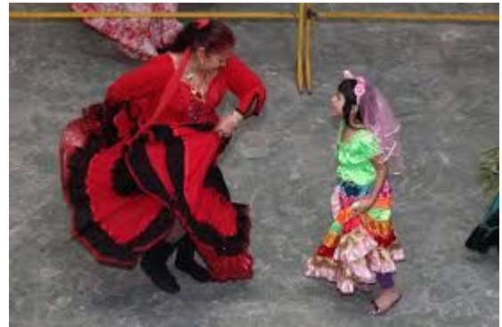
SANTA SARA, MORRO DA NOVA CINTRA.