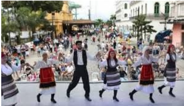
FESTIVAL DO IMIGRANTE, CENTRO DE SANTOS.

B.OBSERVE OUTRAS FESTAS QUE EXISTEM EM SANTOS E FAÇA UM X NAS QUE VOCÊ JÁ PARTICIPOU: