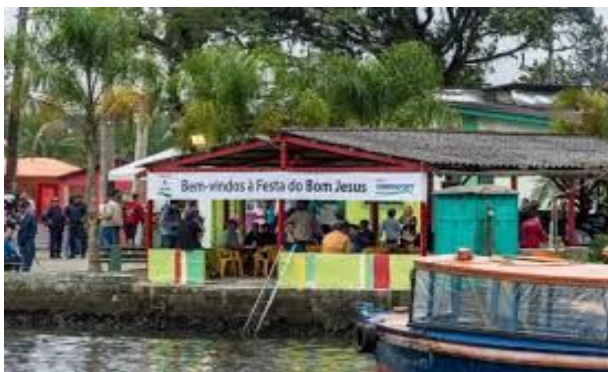
FESTA DO BOM JESUS DA ILHA DIANA.