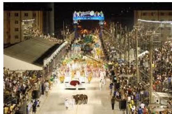
CARNAVAL. PASSARELA DRÁUSIO DA CRUZ, ZONA NOROESTE.