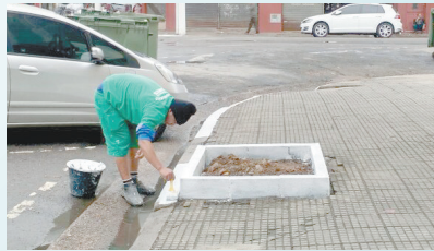
Pintura de guias e covas no entorno do Mercado Municipal - Vila Nova