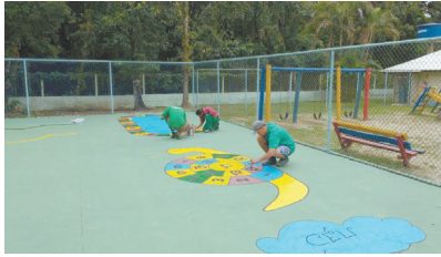
Pintura na quadra da UME Noel Gomes - Caruara