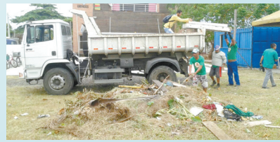
Limpeza Arte no Dique - Rádio Clube