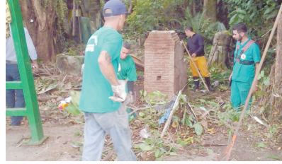
Limpeza e retirada de lixo na futura oficina de artesanato - Caruara