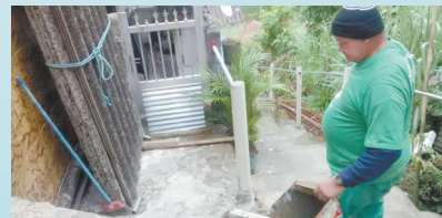
Instalação de corrimão na Rua 7 - Morro José Menino