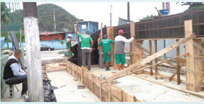
Madeiramento para concretagem de arquibancada na Praça Guilherme Delius - Alemoa