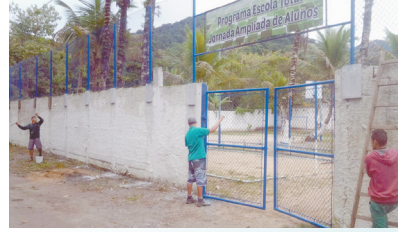
Pintura de muro e alamedado no Núcleo da Escola Total - Caruara