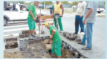
Reparo do abatimento da Rua Afonso Celso de Paula Lima x praia - Ponta da Praia