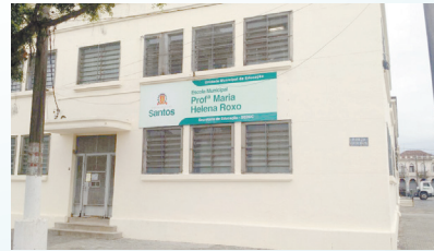
Troca de placas da Escola Maria Helena Roxo - Vila Nova