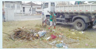
Centro da Juventude. Limpeza geral - Rádio Clube