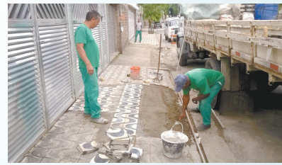
Reparo em calçada danificada por raízes de árvores na Rua Bezerra de Menezes - Estuário