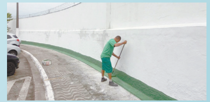
Pintura dos muros do Cemitério Areia Branca