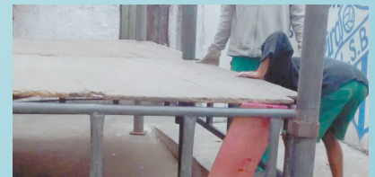
Montagem de palco Largo São Bento - Morro São Bento