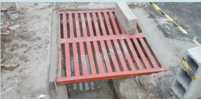
Início da manutenção de grelhas na Rua 7 - M. José Menino