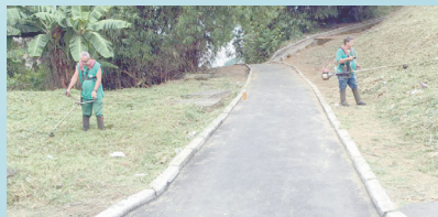
Poda de jardins e árvores em toda a extensão do Cruzeiro - Morro São Bento