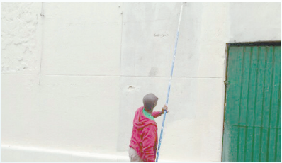
Continuação da pintura do complexo do Mercado Municipal - Vila Nova