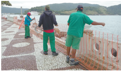
Isolamento dos trechos danificados na orla da Ponta da Praia