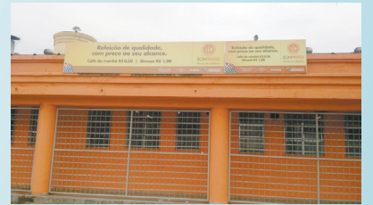
Troca das placas do restaurante Bom Prato - Vila Nova