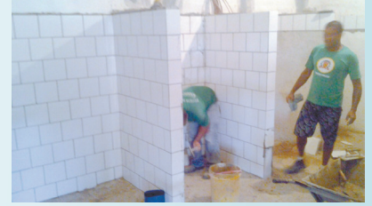
Aplicação de revestimento cerâmico e vestiário Sociedade Esportiva Caruara