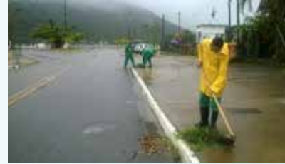
Limpeza dos canteiros da Av. Andrade Soares - Caruara