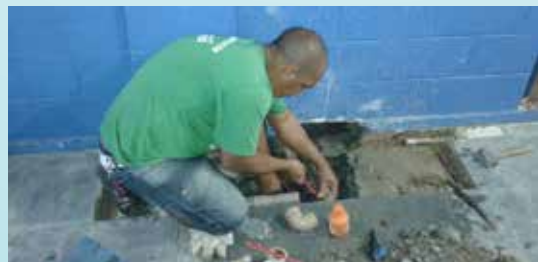
Reparo em tubulação rompida na UME Yara Santini - Castelo