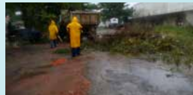
Corte de mato e retirada de lixo e entulhos no terreno do DER - Jardim Piratininga