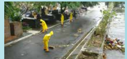
Varrição das alamedas do Cemitério da Areia Branca