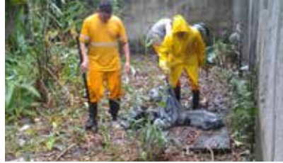
Operação Cata Treco no terreno dos fundos do Nias - Caruara