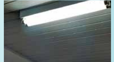
Instalação de luminárias na escola Rubens Lara - Morro Nova Cintra