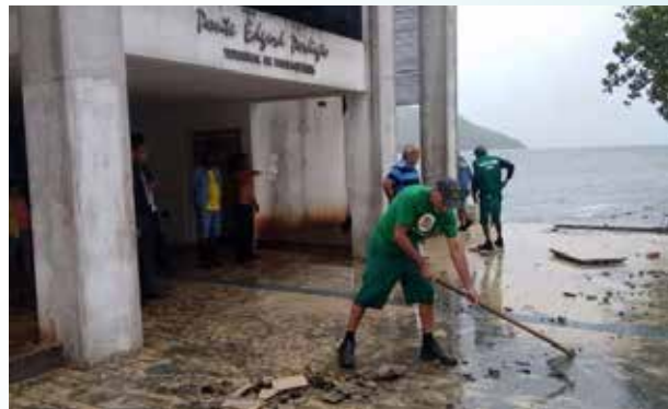
Limpeza Ponte Edgard Perdigão - Ponta da Praia