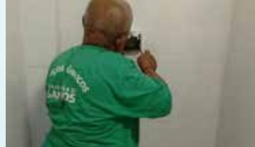
Instalação de canoplas hidra na Escola Rubens Lara - Morro Nova Cintra