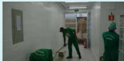
Pintura interna do Serfis - Bom Retiro