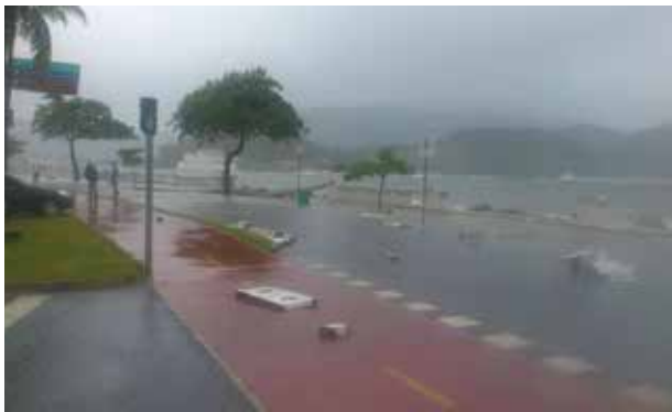
Limpeza dos resíduos da ressaca - Orla