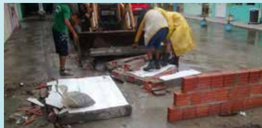
Retirada de entulhos na Vila Criativa - Rádio Clube