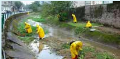
Limpeza do canal na Rua Maria Mercedes Féa - Saboó