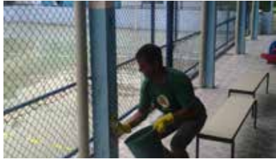
Lavagem no madeiramento do pátio da UME Monte Cabrão