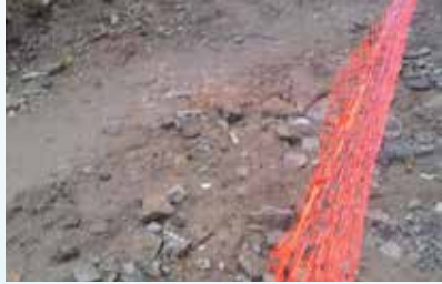
Calçada do Teatro Municipal - Vila Mathias