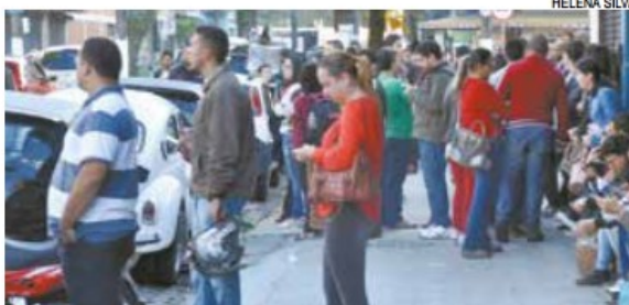
Participaram das provas objetivas 7.108 candidatos

Exames tiveram a participação de 7.108 candidatos, na disputa por 26 vagas em nove cargos: advogado, agente administrativo, assistente social, contador, encarregado, enfermeiro auditor, médico auditor, técnico auxiliar de administração e técnico de contabilidade. Habilitados nos cargos