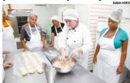
Cursos são direcionados a ex-alunos de panificação

A Vila Criativa Mercado recebe hoje inscrições de ex-alunos do curso de panificação, interessados em fazer as capacitações em massas folhadas e produtos natalinos.