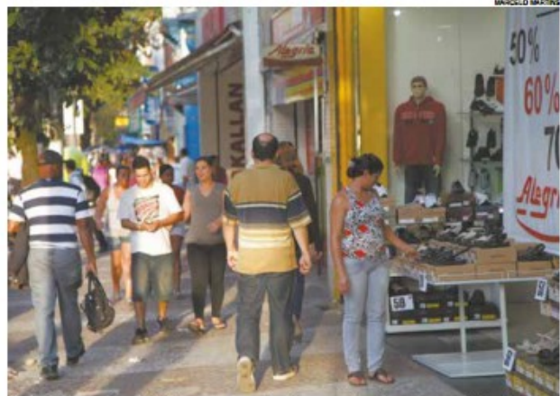
Segundo consultor do Sebrae, pressa dos transeuntes deve ser considerada

1 Endereço da Sala do Empreendedor Santista