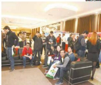
Evento Metropolitano de Tecnologia ocorre até amanhã