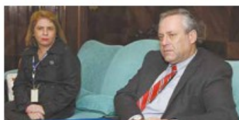
Representantes do Sebrae (abaixo) estiveram no Paço para entregar o certificado do Prêmio Prefeito Empreendedor