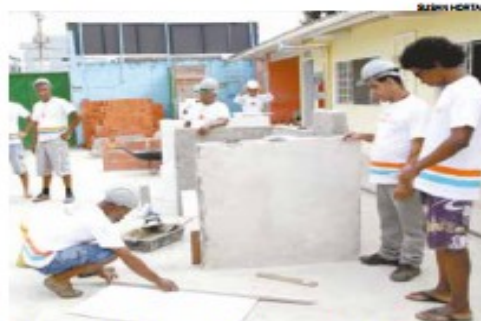
Escola de Beleza ensina técnicas de maquiagem e há as qualificações na área de construção civil