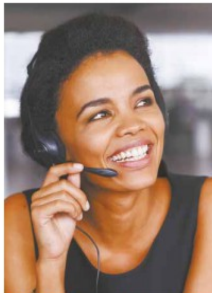
Para trabalhar como teleoperador, candidato precisa ter cursado ensino médio; não é necessária experiência

Outras vagas são para costureira de máquinas industriais e mecânico de automóveis. Interessados devem comparecer no Centro Público com RG, CPF, PIS ou cartão cidadão e carteira de trabalho.