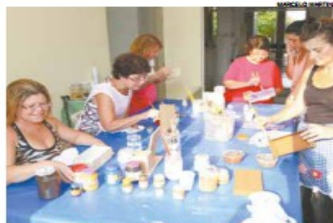
Aulas de padaria artesanal e de artesanato estão entre as muitas capacitações oferecidas gratuitamente