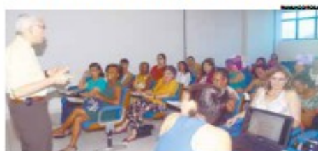
Aulas ocorrerão entre 13 e 17 junho, na Unisantia

A Coordenadoria de Políticas para a Mulher recebe até o dia 31 a inscrição de interessadas em participar do curso Construindo Rumos, que incentiva o empreendedorismo feminino e estimula sua autonomia.