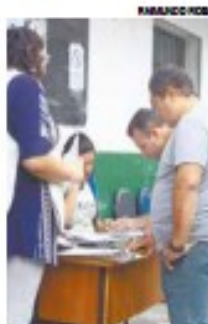
Um total de 132 pessoas participou dos testes

No dia 22, os testes ocorrem para estofador, operador de máquinas, pedreiro, pintor e instrutor de artes culturais nas modalidades artes cênicas, artes visuais e dança.