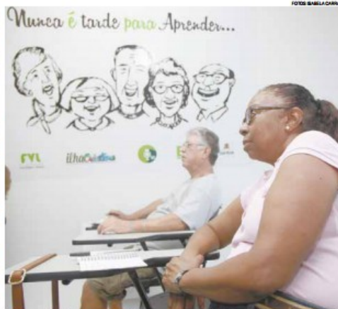
Alunos terão palestras sobre vários temas e a capacitação em técnicas de rádio

À tarde, interessados ainda podem fazer aula de arte apleque. Tudo no mesmo local: a Ilha Criativa (Av. Conselheiro Nébias com a Av. Vicente de Carvalho).