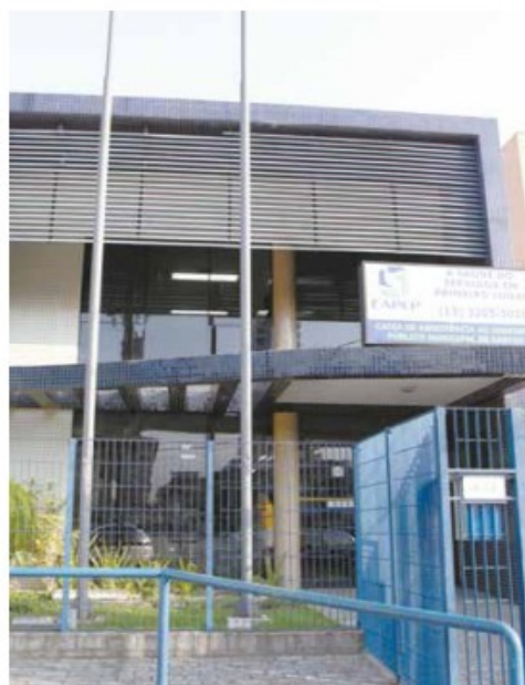
A autarquia recebe inscrições até o próximo dia 28

Também é a primeira vez que promove seleção para cargos como os de assistente social e de médico e enfermeiro auditor.