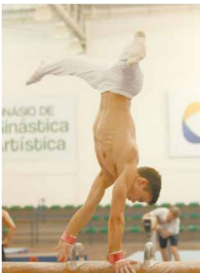
Ginásio na Zona Noroeste recebe atletas de cinco países

Outro evento é o Nerd Cine Fest, que ocorre anualmente e exibe filmes clássicos de super-heróis, ficção científica e terror, seguidos de debates com o público.