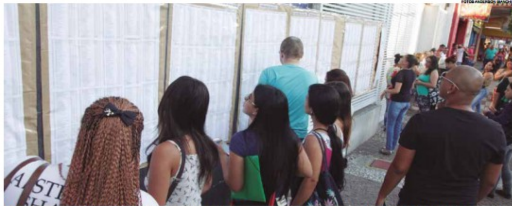
Muitos dos inscritos chegaram com antecedência aos locais dos exames e conferiram o nome na lista de convocados; gabarito sai amanhã

As 96 vagas são para: atendente de ouvidoria, oficial de administração, agente cultural, almoxarife, guia de turismo regional, operador social, cenógrafo, desenhista-projetista, fiscal de posturas, técnicos (vários), agente de ris-