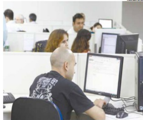
Profissional deve demonstrar disponibilidade para inovações

"A pessoa que causa problemas numa equipe, em uma hora de corte será lembrada porque destoa dos demais. Não se envolver em fofocas, não reclamar que trabalha mais que os outros, não se fazer de vítima ou se ausentar constantemente do trabalho são medidas primordiais. Quem sempre está com problema, quando realmente precisar, a chefia não vai acreditar e poderá não dar o apoio no momento de real dificuldade", acrescenta.