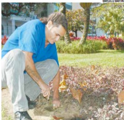
Cargo de jardineiro é um dos oferecidos em edital