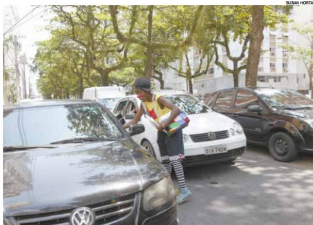
Ação conta com cenas nas ruas, cartazes e distribuição de material informativo

"O trabalho infantil é multifacetado e complexo. Somente com a união de todos os órgãos que têm interface nessa área seria possível termos um reconhecimento", afirma a secretária municipal de As-