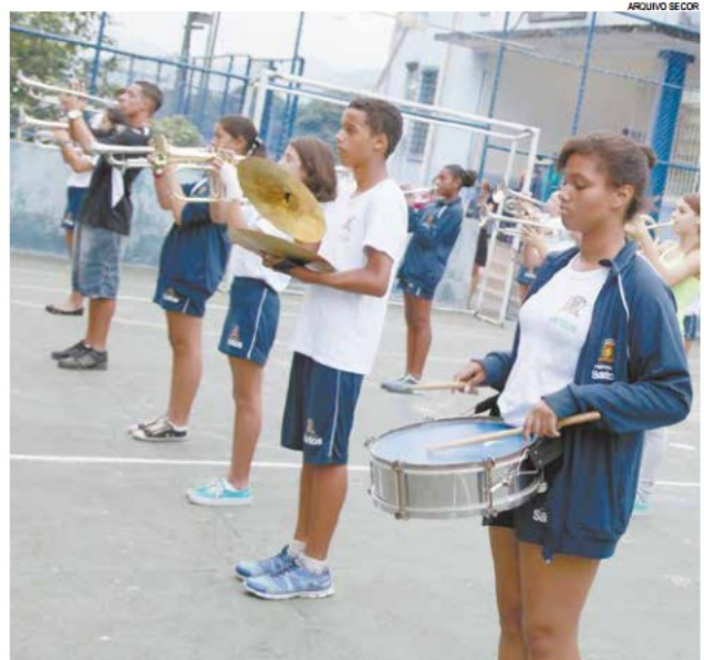
Por meio da iniciativa, bandas estudantis são formadas nas unidades da rede municipal

Aprovado atuará como educador responsável pelo trabalho com a comunidade escolar e pelas atividades educativas em uma das unidades municipais participantes (Pedro II, José Carlos de Azevedo Júnior, Vinete e Oito de Fevereiro, Mário de Almeida Alcântara e Barão do Rio Branco).