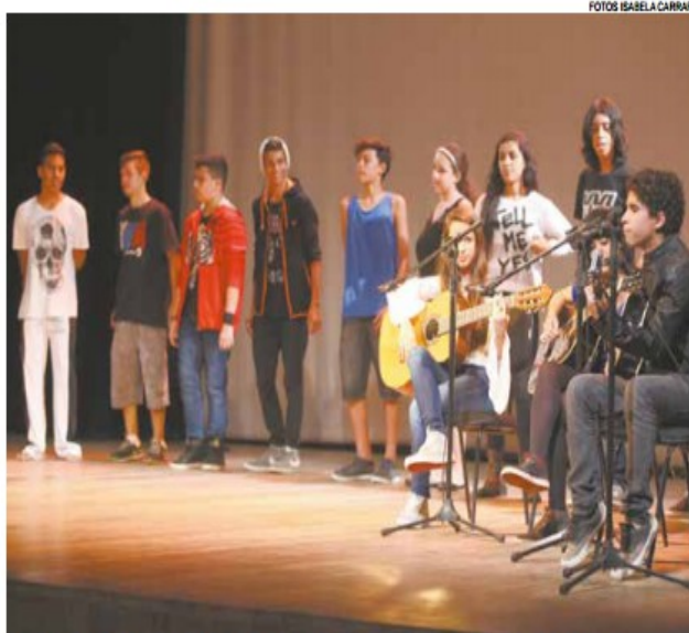
Cerimônia de premiação teve apresentações artísticas no Teatro Guarany