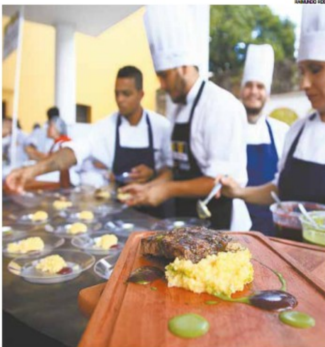
Pratos que concorrem no festival poderão ser degustados pelo público na Setur

INSCRIÇÕES PARA WORKSHOP NO MUSEU PELÉ: LIANA@PRAZERESDAMESA.COM.BR DEGUSTAÇÃO PÚBLICA PARTIR DAS 15H NO LARGO MARQUÊS DE MONTE ALEGRE, 2, VALONGO