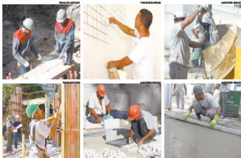
Estão envolvidos profissionais como pedreiros, pintores, azulejistas, carpinteiros, eletricitas, entre outros

que se dividiram em atividades na obra e no barracão onde foram executadas as lajes pré-moldadas. Os trabalhadores foram selecionados por meio de currículos entregues na Subprefeitura dos Morros. Com a continuidade dos serviços, ficaram os aptos para funções que exigiam habilidades específicas.