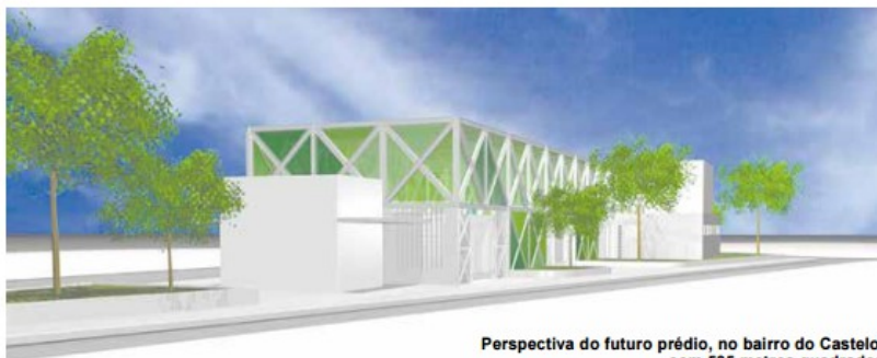
Perspectiva do futuro prédio, no bairro do Castelo, com 505 metros quadrados