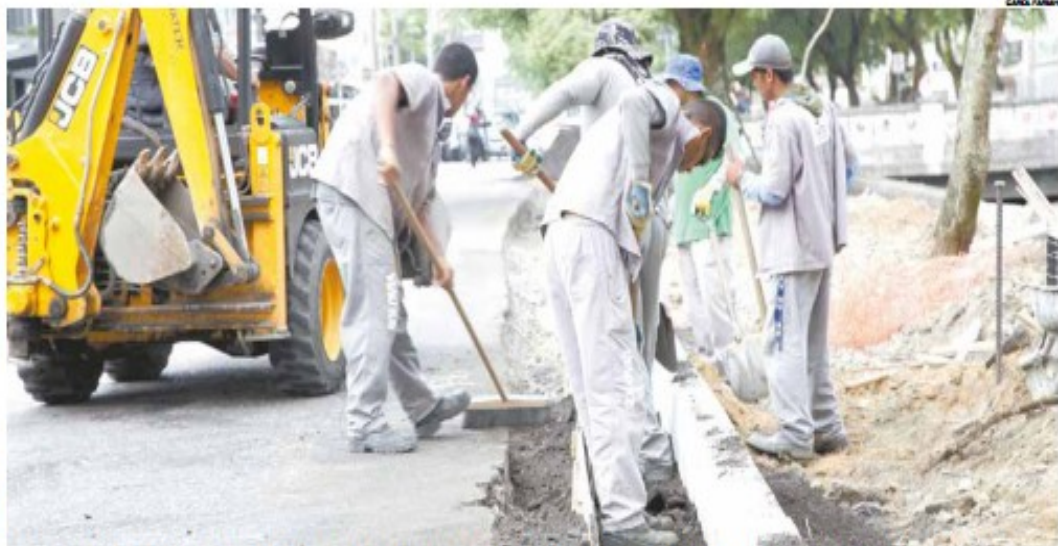
Trabalhos envolvem obras de mobilidade, revitalizações de espaços públicos, construções de equipamentos e manutenção urbana

A Siedi supervisiona atualmente 15 obras de infraestrutura e outras 22 prediais. Já a Seserp executa ações que auxiliam no desenvolvimento urbano, plano viário, além da manutenção preventiva e corretiva de edifícios e logradouros públicos. Também é responsável por serviços como coleta e destinação do lixo, pavimentação, poda de árvores, água, esgoto, energia elétrica e telefonia.