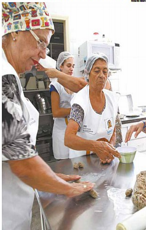
Maior quantidade de vagas está destinada para o curso de panificação artesanal

O programa Geração de Renda, do Fundo Social de Solidariedade (FSS), inscreve somente amanhã para 104 vagas em quatro cursos de capacitação de profissional gratuitos.