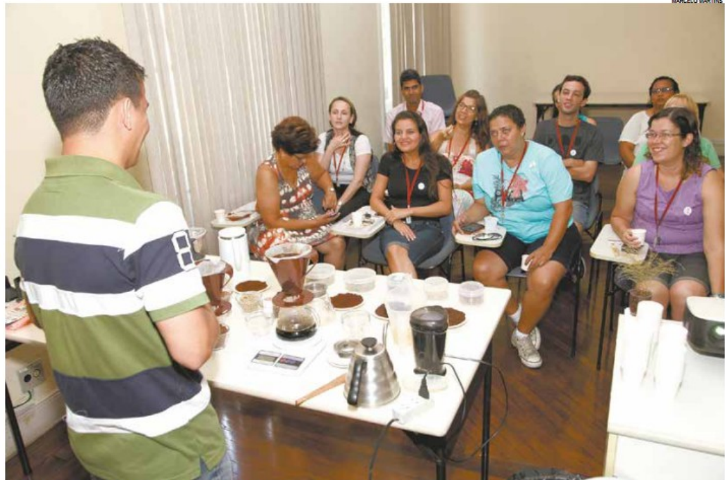
Técnicas de preparo do café para uso em bebidas e orientações gastronômicas serão dadas em atividades no Museu Pelé