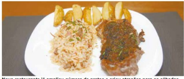
Novo restaurante já ampliou número de pratos e criou atrações para os sábados