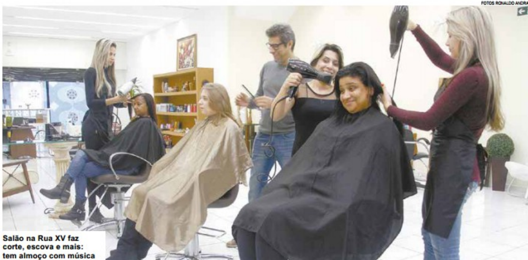
Salão na Rua XV faz corte, escova e mais: tem almoço com música e até champanhe