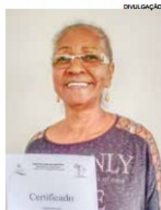
Entrega de certificados

cursos abrem amanhã, com turmas pela manhã, tarde e noite. No segundo semestre, os cursos serão incluídos na modalidade educação à distância.