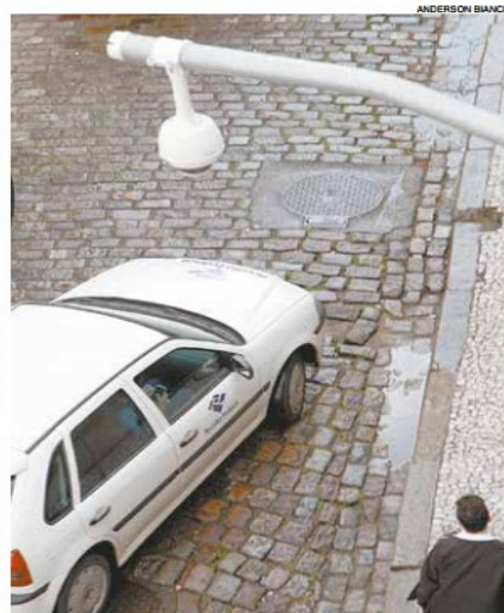
Monitoramento por câmeras atraiu pesquisadores

O trabalho se transformará numa publicação, prevista para outubro, com exemplares distribuídos às prefeituras do País e conteúdo disponível na internet. Antes, será realizado em São Paulo um seminário para apresentar os resultados da pesquisa.