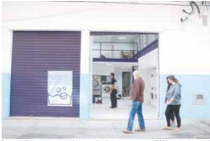
Investimentos em lavanderias crescem 5% ao ano