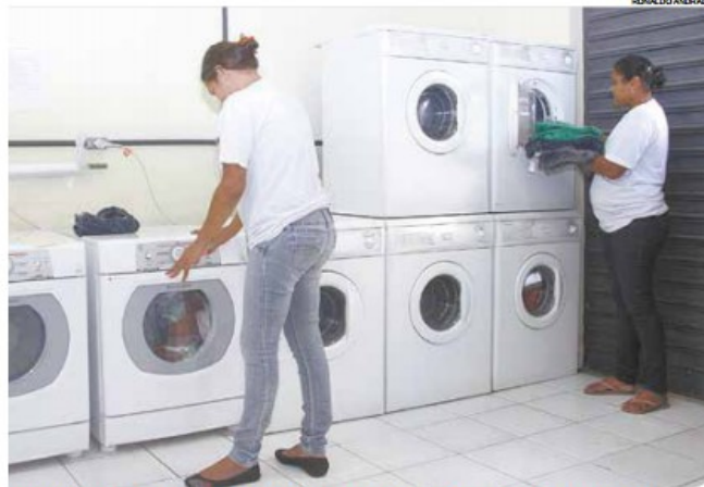
Equipamento funciona na Rua Amador Bueno, 309, de segunda a sábado