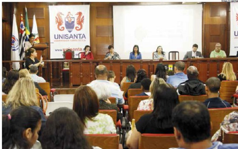
Evento teve apoio de CMDCA, CMAS e da Comissão Municipal de Prevenção e Erradicação do Trabalho Infantil

Durante o seminário, a Secretaria de Educação (Seduc) entregou prêmios aos alunos de nove escolas municipais que participaram do concurso "Brincar, estudar, viver... trabalhar quando crescer".