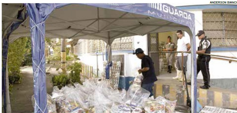
Alimentos serão entregues aos prejudicados pelas consequências ambientais