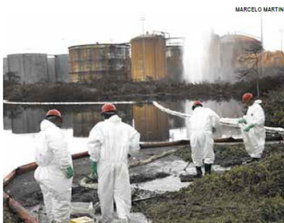
Incêndio ocorreu na empresa no mês de abril