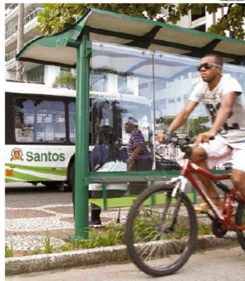
Política cicloviária e transporte público são temas do congresso

Dias 23 e 25 de junho, no Mendes Convention Center.