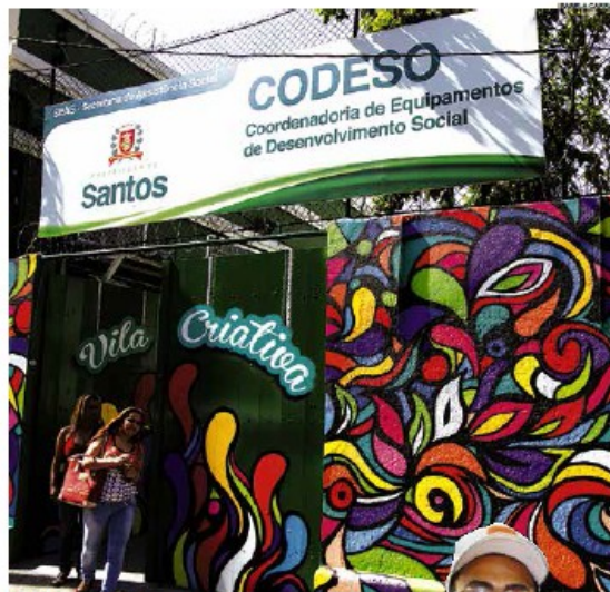
Unidade da Prefeitura encaminha para o treinamento

"Não pode ir de bonê, blusa aberta, saia curta, falar gíria. A pessoa precisa entender que pode estar qualificada para a vaga, mas se não tiver um comportamento adequado não terá chance de mostrar o que sabe".