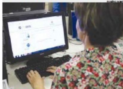
Ferramenta permite que empresários se cadastrem

Em conjunto com a Secretaria de Comunicação e Resultados (Secor), foi criado o site do programa no portal da Prefeitura ( www.santos.sp.gov.br/licitasantos ), onde é possível se cadastrar para receber por e-mail os avisos de edital das licitações, de acordo com a área de interesse.