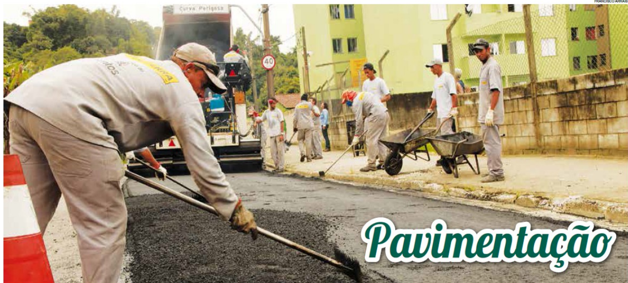
Trecho de 150 metros da Avenida Brasil, no Morro da Nova Cintra, recebeu novo asfalto em mais uma obra de melhoria da acessibilidade > Página 4

Há opções para formação na Escola de Beleza e em modalidades que incluem cartonagem, pintura em tecido e em madeira e panificação artesanal; inscrições serão recebidas apenas amanhã, na sede do órgão > Página 2