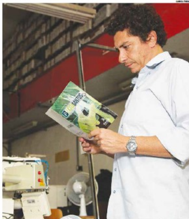
Programa distribuirá cartilhas explicando didaticamente os processos licitatórios

"Ao incentivar o empresário, vamos gerar emprego e ajudar a manter a riqueza local. A Prefeitura não pode favorecer ou direcionar as licitações, exte-