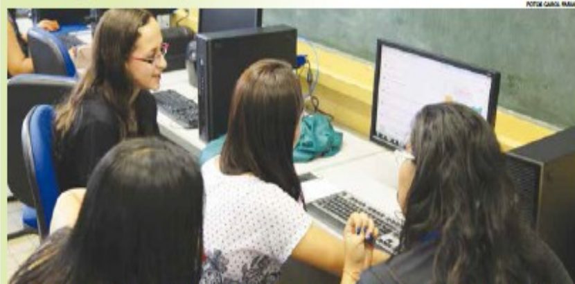
Entre as 680 oportunidades na Escolástica Rosa, há formações na área de Informática, incluindo Programa de Jogos Digitais

As ETECs Escolástica Rosa e Aristóteles Ferreira estão com inscrições abertas para o vestibulinho de 19 cursos gratuitos, que somam 1.115 vagas.