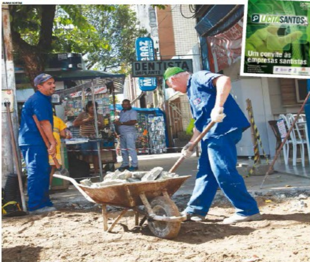
Trecho da Rua Riachuelo segue com obras de revitalização licitadas pelo Município > Página 4

Programa lançado ontem pela Administração Municipal estimula empresariado a participar de processos licitatórios; ações incluem parceria com entidades do setor, distribuição de cartilha e portal na internet > Páginas 3 e centrais