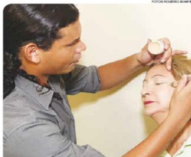
Capacitações incluem a Escola de Beleza e modalidades como pintura em tecido e em madeira

Interessados devem estar munidos de cópia do RG, CPF, comprovante de residência e de renda. Também é preciso levar um pacote ou lata de leite em pó integral de 400 gramas.