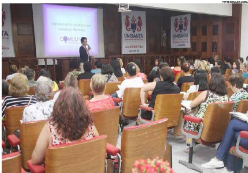
Com noções de cidadania e política para o público feminino, evento teve início segunda-feira no consistório da universidade

Outros temas da capacitação: Divisão dos poderes, presidencialismo, parlamentarismo e federalismo; A participação política e políticos no Brasil; Sistema eleitoral e competência dos cartórios eleitorais; Política internacional e o contexto da globalização; Sistema político e proposta de reforma; Pesquisas políticas e eleitorais; Democracia e desenvolvimento econômico e Mídia, marketing e política.