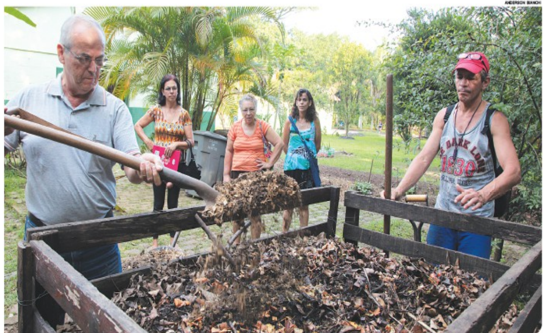
Cursos de horta tem conceito de sustentabilidade e inclui aulas a respeito de produção de mudas, compostagem e minhocultura

São 40 vagas, a partir dos 14 anos (menores de idade devem vir acompanhados dos responsáveis). As atividades acontecem das 14h às 17h, com duração aproximada de quatro meses. Have-