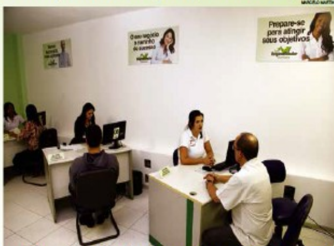
Sala do Empreendedor, da Prefeitura, foi especialmente criada para atender empresários