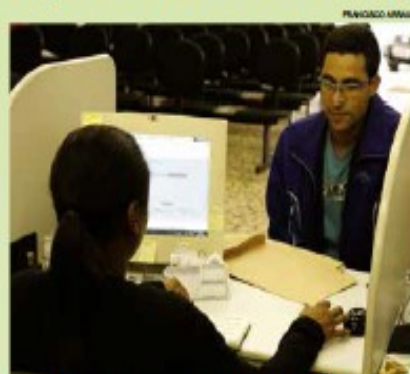
Maior salário oferecido pela unidade é de R$ 1.200,00

O Centro Público de Emprego e Trabalho de Santos, coordenado pela Prefeitura e Ministério do Trabalho, possui diversas vagas com salários que variam entre R$ 724,00 e R$ 1.200,00. Para vendedor externo são duas oportunidades para pessoas que possuem CNHA ou B. Não é necessário ter experiência. O salário oferecido é de R$ 1.147,20 mais vale transporte e cesta básica.