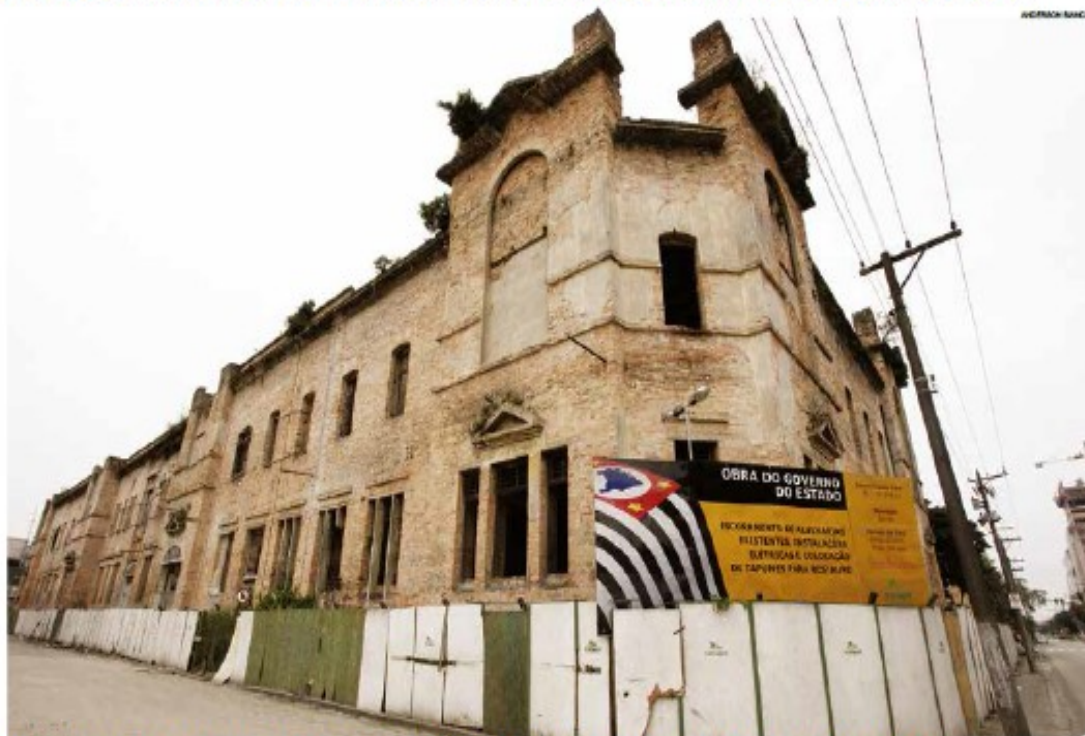
Edifício histórico tem área de 14,6 mil m 2 , contará com 28 salas e poderá receber um novo curso de Tecnologia de Gás e Petróleo

O investimento do Estado será de R$ 70 milhões e a recuperação da futura sede da Fatec deve começar neste semestre, com previsão de término em três anos. Na área de 14.600 mil m 2 haverá 28 salas.