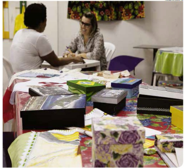
Equipamento da Secretaria de Assistência Social oferece capacitação em várias atividades

Os alunos são munícipes já atendidos pelos serviços socioassistenciais. "Vamos capacitar mais pessoas para o mundo do trabalho, ajudá-las a se estruturar para, no futuro, deixarem de depender da ajuda do poder público".