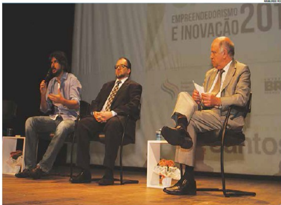
Programação que se estendeu durante todo o dia, no Guarany, apontou caminhos para empreender com criatividade