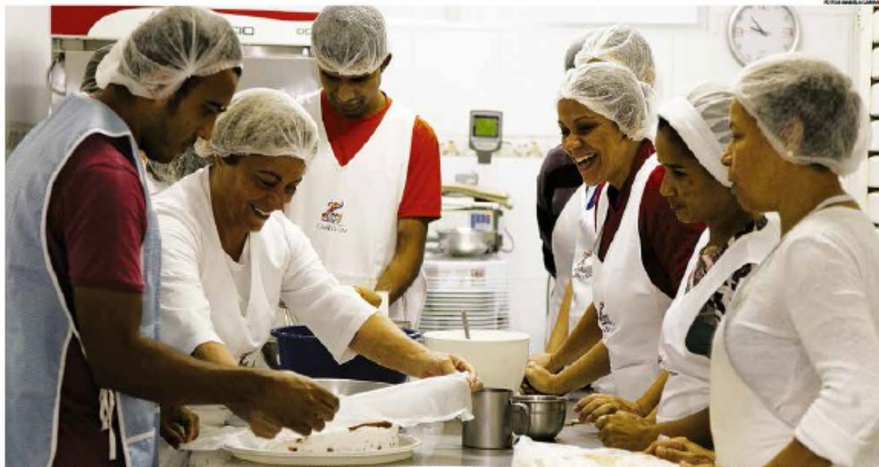
Participantes são orientados sobre a produção de pães, bolos, doces e salgados; com os conhecimentos adquiridos eles podem trabalhar por conta própria ou conseguir um emprego

Curso oferecido pela Secretaria de Assistência Social, com certificado do Senai, oferece oportunidades de trabalho