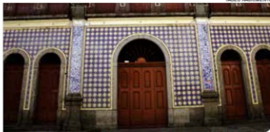
Teste será amanhã na Casa de Frontaria Azulejada

Jovens de 14 a 24 anos, interessados em participar do curta-metragem ‘Azul da Cor do Mar’, podem fazer teste de elenco gratuito amanhã, das 13h às 17h, na Casa da Frontaria Azulejada (Rua do Comércio, 96, Centro). Não é necessária experiência.