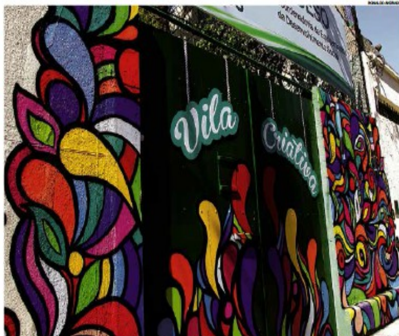
Entregue ontem, a Vila Criativa vai oferecer qualificações à população em situação de rua e em situação de vulnerabilidade