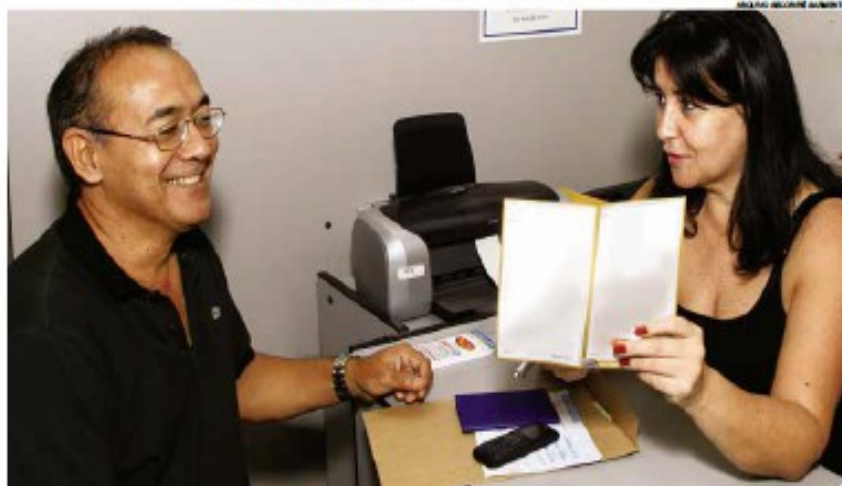
Na unidade de Santos, no Centro Histórico, interessado recebe orientação sobre como ter acesso à linha de crédito

ajuda porque compro mais mercadorias, faço estoque e vendo ao longo do ano, pois compro roupas básicas, que não saem de moda". Ela revela que com o lucro conseguiu reformar a casa, construir alguns cômodos e financiar um carro, "que está quase quitado".