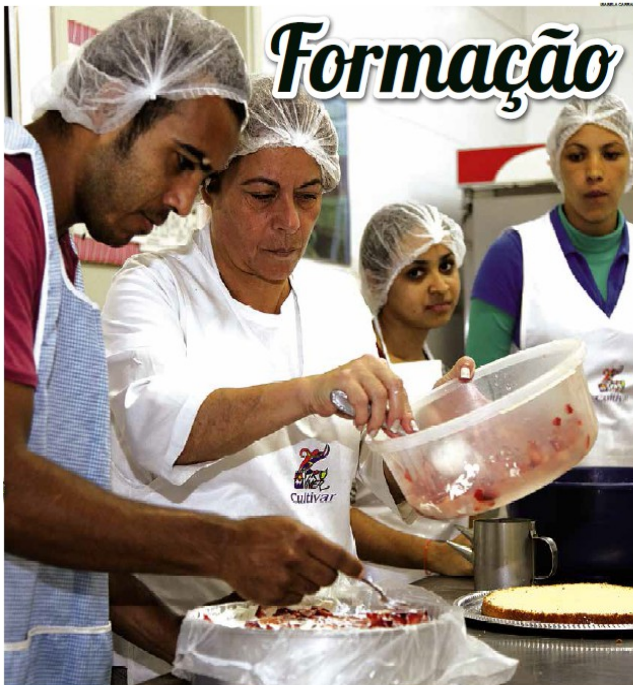
Perspectivas de mudança de vida motivam participantes de curso sobre produção de pães, bolos, doces e salgados > Última página