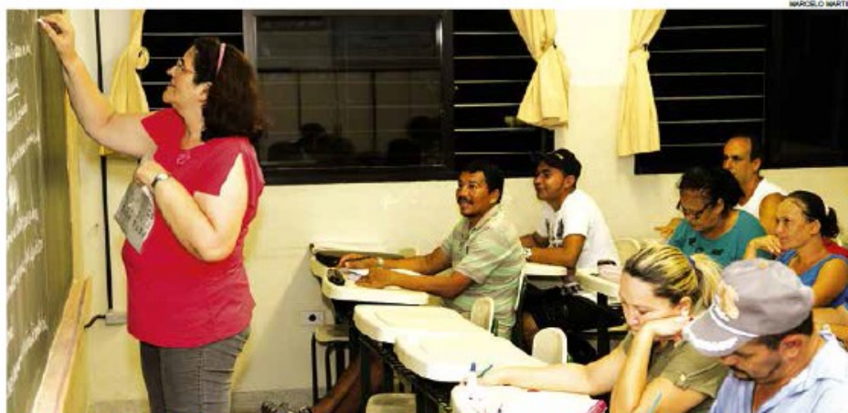
Candidatos devem ter 15 anos completos e as aulas serão realizadas a partir do segundo semestre

Os candidatos devem ter 15 anos completos ou a completar até a efetivação da matrícula. Aqueles que não possuem comprovante de escolaridade, após consulta no Sistema de Cadastro dos Alunos do Estado de São Paulo (GDAE), precisam passar por avaliação classificatória. A rematrícula dos atuais termina amanhã.