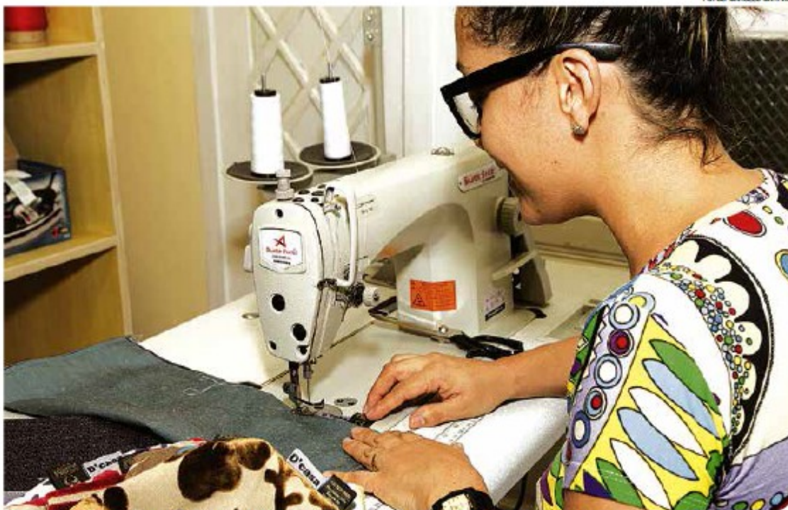
Curso terá duração de dois meses e meio e permitirá que os alunos aprendam a confeccionar roupas e até bolsas

Quem deseja aprender os segredos do corte e costura e ingressar neste mercado de trabalho poderá participar do curso Escola de Moda, promovido pelo Fundo Social de Solidariedade (FSS). As inscrições serão apenas amanhã, na sede do órgão (Av. Conselheiro Nébias, 388), das 9h às 11h30 e das 14h às 17h.