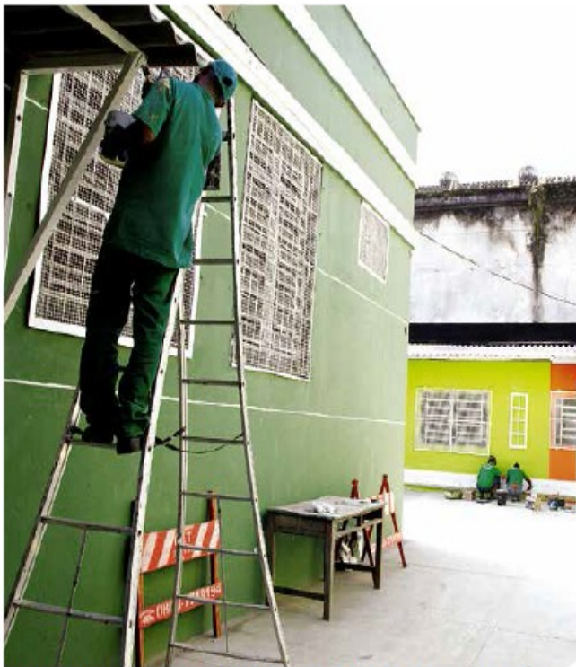
Pintura geral foi um dos serviços executados no imóvel, que sediará diversos cursos