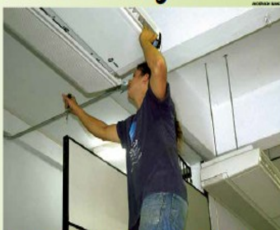
A função de mecânico de refrigeração oferece salário de R$ 1.500 e benefícios

A unidade fecha para almoço às 12h, retomando das 13h até 17h, quando serão entregues outras 30 senhas (15 para seguro-desemprego e 15 para cadastro e atendimento de retorno).