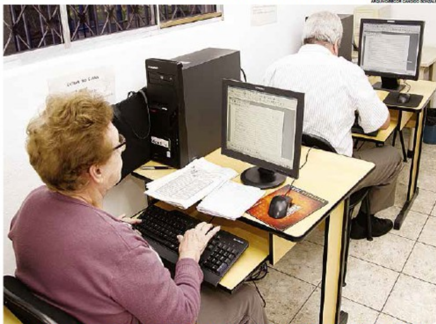
Curso 'Vovônauta' é direcionado para maiores de 60 anos e as vagas serão preenchidas conforme ordem de inscrição

Com duração de 30 horas, os cursos ensinam a utilizar o sistema Windows 7, internet e outros recursos da informática. As aulas ocorrerão duas vezes por semana. Mais informações pelo telefone 3222-1050.