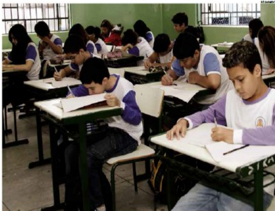
Competição entre escolas públicas em todo o país visa incentivar o desenvolvimento e o gosto pela disciplina

Iniciativa rendeu três bronzes, sete menções honrosas e prêmio a professora