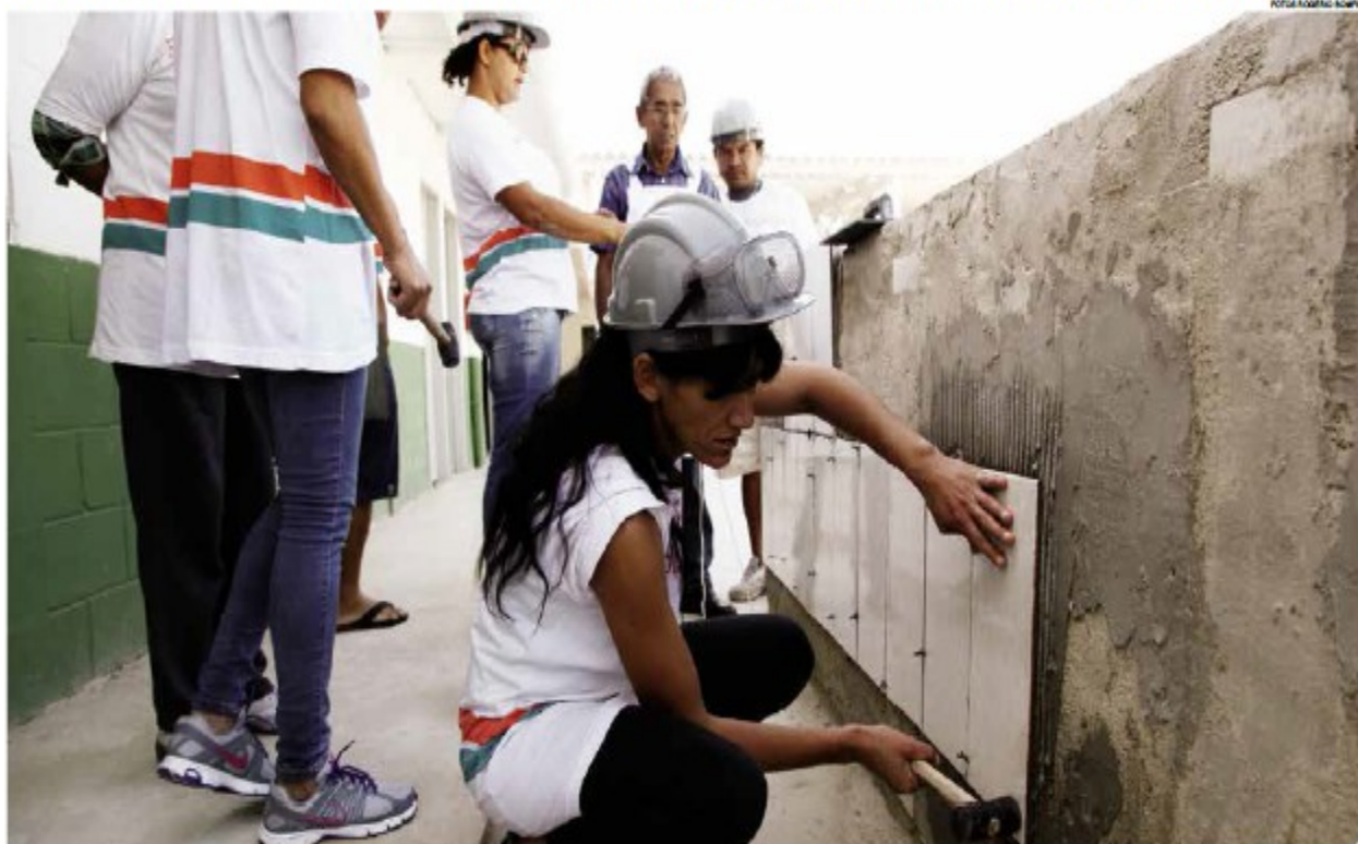
Curso de assentador de pisos e azulejos atraiu muitas mulheres; na unidade de formação instalada na Zona Noroeste também houve capacitação para encaixador e pedreiro

Os 45 alunos frequentaram as aulas durante dois meses; inscrições para novas turmas estão previstas para julho