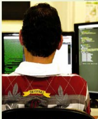
Curso de programador web será na 'Aristóteles'

A Eletc Aristóteles Ferreira ministrará de 23 de junho a 1º de setembro, das 14h às 18h, os cursos de organizador de eventos (180 horas-aula) e o de programador web (200h). Os Interessados devem ter, no mínimo, o ensino fundamental completo. Já na Regional da Zona Noroeste será ministrado o curso de assistente de logística portuária (160 horas), de 24 de junho a 27 de agosto, das 14h às 18h. Para participar é preciso ter mais de 16 anos, ensino médio completo e cadastro único do Ministério de Desenvolvimento Social.