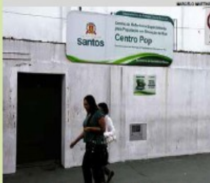
Centro Pop é um dos locais que recebem inscrições