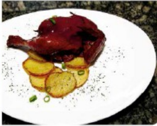
Prato principal foi o coq au vin (galo ao vinho)

No dia 5 de agosto terão início as aulas da quinta turma de aprendizes do restaurante-escola. Vinte e cinco jovens vão fazer seis meses de curso, onde aprenderão técnicas de culinária e atendi-