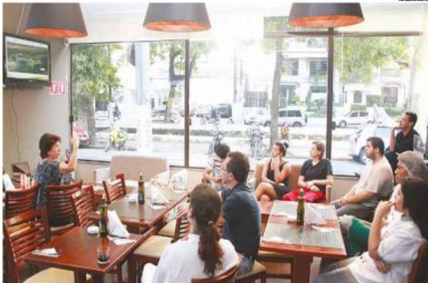
Técnica da secretaria fala sobre aspectos geográficos, históricos, culturais e atrativos turísticos da cidade

Objetivo é preparar áreas ligadas ao turismo para melhor atendimento a visitantes