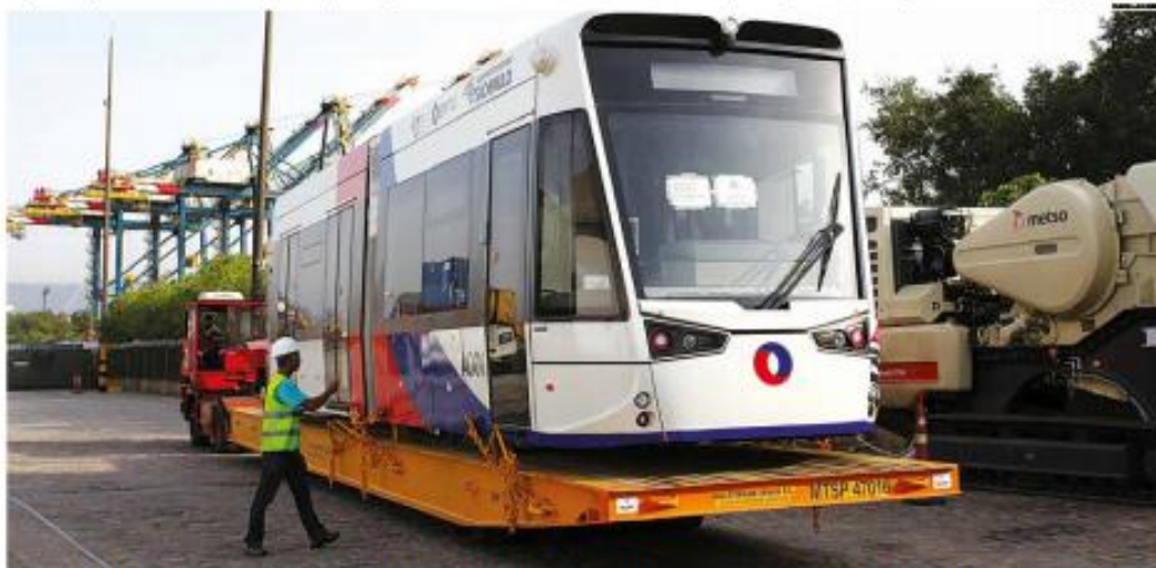
Um dos vagões é movimentado em pátio de terminal portuário para ser levado a São Vicente, na próxima segunda-feira, onde serão realizadas provas

Composição saiu da Espanha no dia 14 de abril e chegou ontem em terminal no cais santista; próxima etapa da implantação do sistema de transporte prevê vários testes, inclusive com passageiros, em agosto > Última página