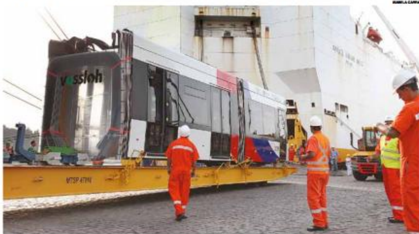
Módulos saíram de Bilbao (Espanha), passaram pela Antuérpia (Bélgica) e foram desembarcados em terminal santista

Os serviços em Santos continuam no Túnel José Menino, Pátio Porto, além