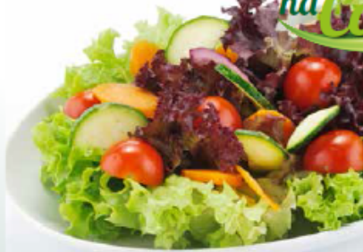
Saladas estão entre os pratos priorizados pelos mexicanos

Peixes, massas e saladas. Essa será a dieta básica da seleção do México durante sua permanência em solo brasileiro, mais especificamente em Santos. Tudo que for consumido pelos 23 atletas que fazem parte do plantel azteca será minuciosamente inspecionado pela chefia da delegação e o nutricionalista da seleção.