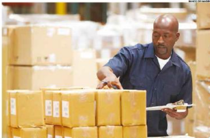
Uma das capacitações oferecidas é para a função de auxiliar de logística

A capacitação é realizada em turmas pela manhã, tarde e noite, de segunda a sexta, com carga total de 160 horas (dois meses de duração). Os participantes recebem