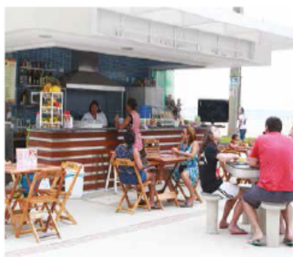
Funcionários de quiosques passarão pela capacitação