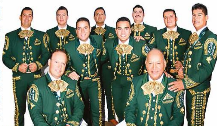
O grupo Mariachi Real de América se apresenta às 17h, na Praça Luiz La Scala, junto ao Aquário Municipal

O 'Mariachi Real de América' é originário de Jalisco, leste do México, local de origem da música dos mariachis. O grupo tem 20 anos de experiência e dois discos. São 12 integrantes, com sete violinos, dois trompetes, guitarra, violão e a tradicional vihuela. Já se exibiu nos mais importantes festivais de música mexicana, como o Encontro Internacional do Mariachi.