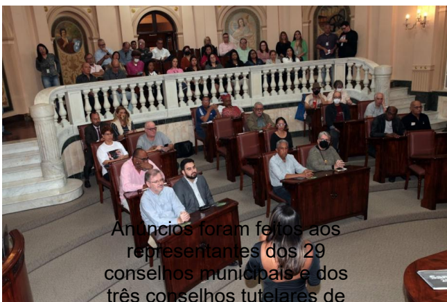
Anúncios foram feitos aos representantes dos 29 conselhos municipais e dos três conselhos tutelares de Santos.