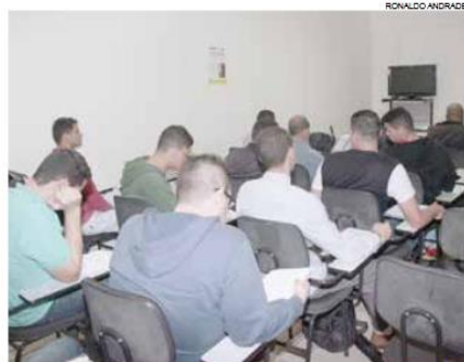
Pessoal assinou documentos para atuar em duas redes

O processo seletivo foi coordenado por uma empresa de recursos humanos, que utilizou a estrutura do Centro Público. "Fazemos os encaminhamentos e disponibilizamos salas, computadores, internet, espaço para exame médico e o que mais o empregador precisar",