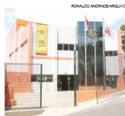
Serviço será retomado amanhã

O restaurante popular Bom Prato Morros (Av. Santo Antônio do Valongo com a Rua dos Padres) terá uma nova en-