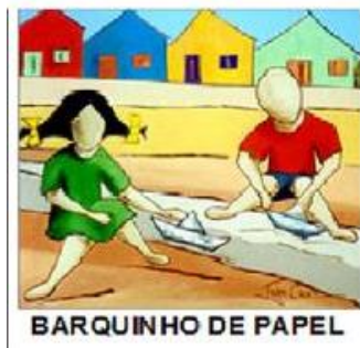
BARQUINHO DE PAPEL