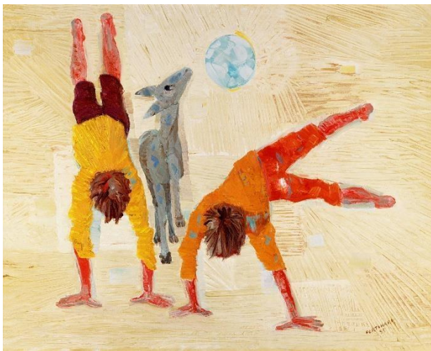
Figura 1 Meninos brincando, 1955, Portinari.

O artista brasileiro Candido Portinari (1903 - 1962) tinha como um dos temas favoritos de suas pinturas as brincadeiras e os jogos infantis. Portinari cresceu em uma cidadezinha tranquila do interior de São Paulo chamada Brodósqui. Inspirado por sua infância, um grande número de suas obras retrata crianças brincando livre e felizes nas ruas. Observe as duas imagens abaixo: