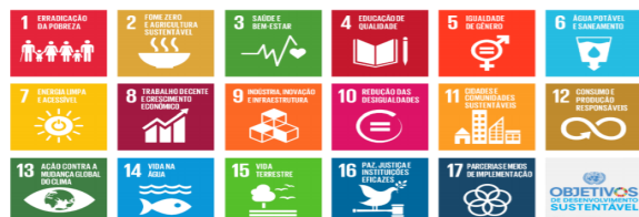
Figura 1: Objetivos de Desenvolvimento Sustentável