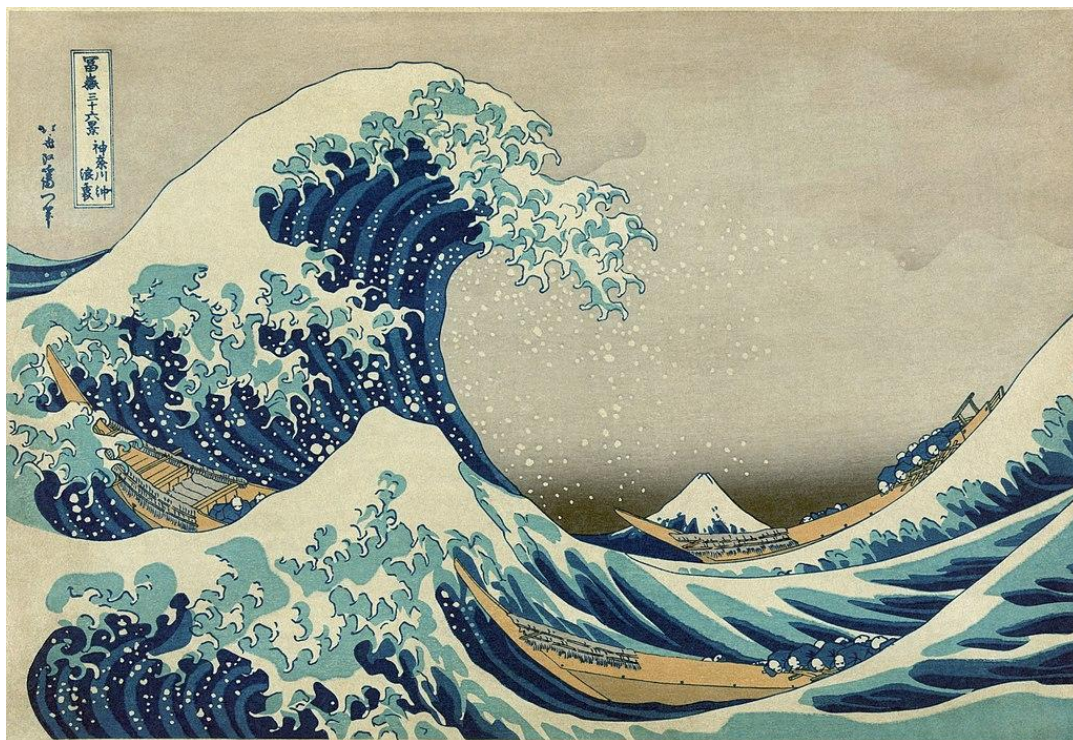
A Grande Onda de Kanagawa, 1830, Katsushika Hokusai