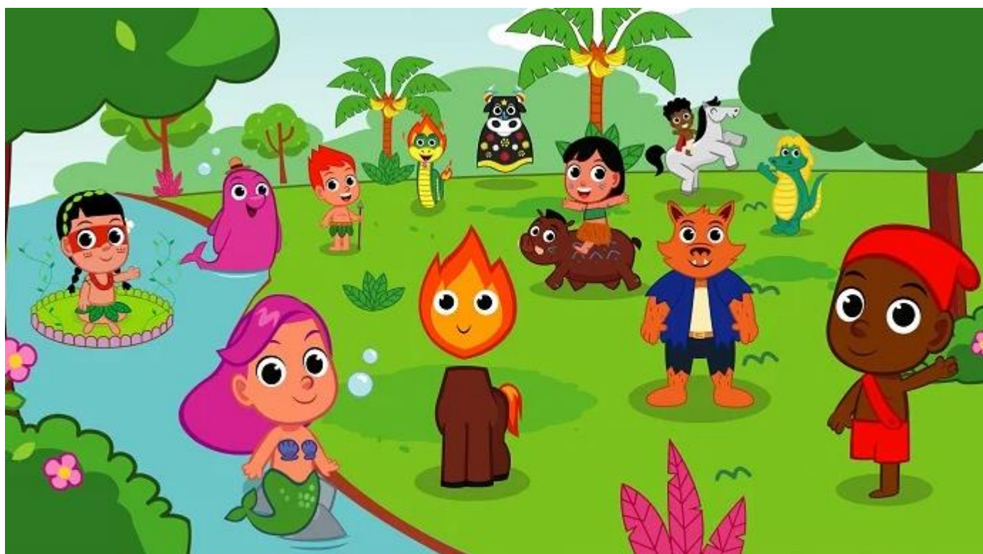
Turma do Folclore

LINK - PERSONAGENS FOLCLÓRICOS: https://youtu.be/KWgCHEMg9uQ