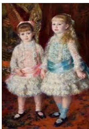
Rosa e Azul – Renoir