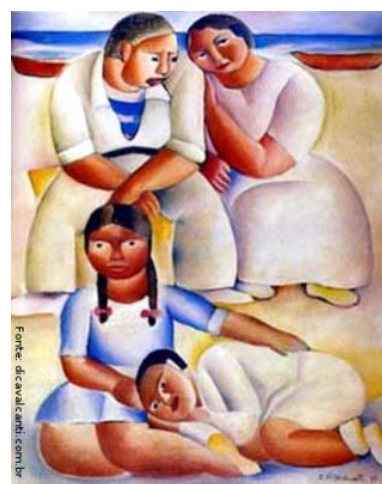
Família na Praia – Di Cavalcanti