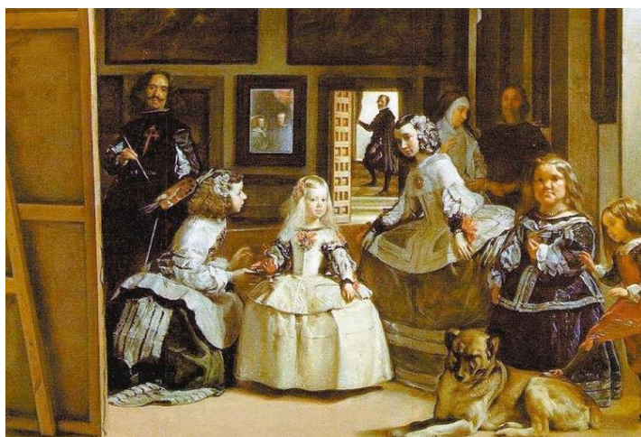
As Meninas – Diego Velázquez