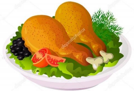
CHICKEN AND SALAD