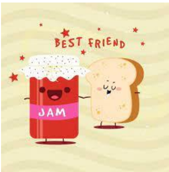
BREAD AND JAM