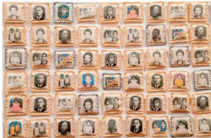
Imagem da obra Parede da memória, 1994-2015

Há artistas visuais que se valem dos objetos de memória para criar suas obras, como a artista brasileira contemporânea Rosana Paulino. Em algumas de suas obras, ela faz intervenções com linha e agulha em fotos de mulheres da sua família para evidenciar o silenciamento da mulher negra, muitas vezes em razão da violência doméstica.