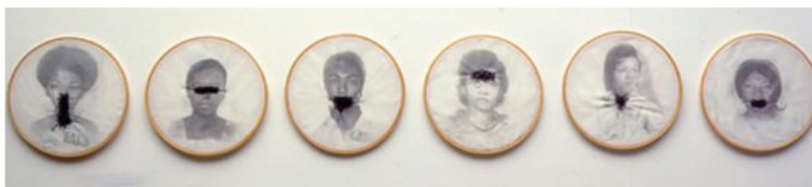
Imagem da série Bastidores, de 1997