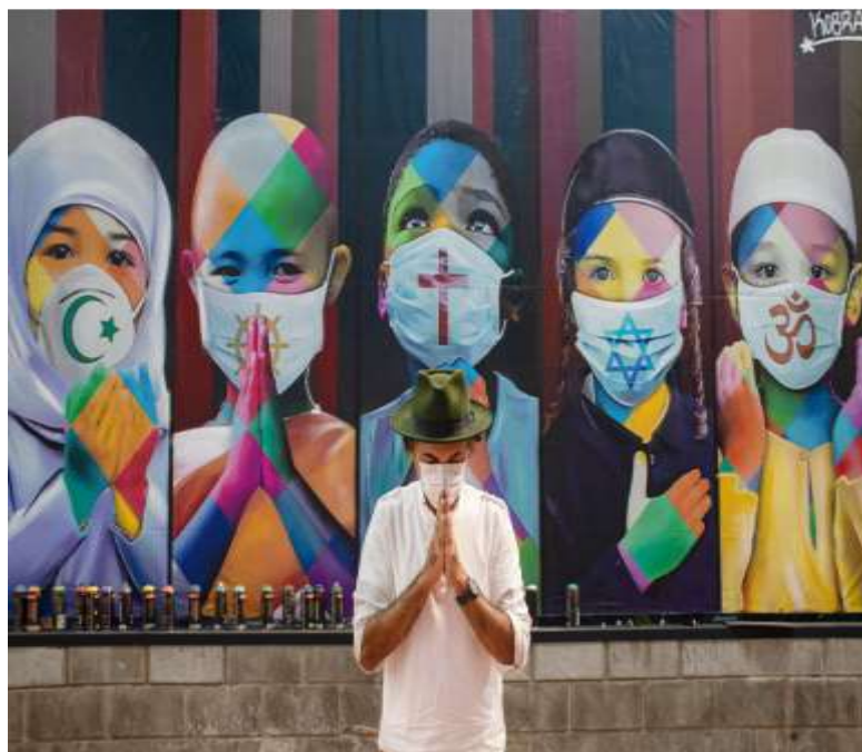
EDUARDO KOBRA - COEXISTÊNCIA, São Paulo, 2020.

https://moodle.ufsc.br/mod/hvp/view.php?id=2421297