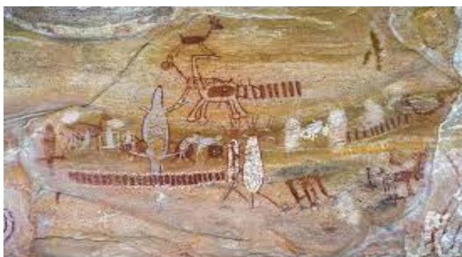
Pinturas rupestres no Parque Nacional da Serra da Capivara.