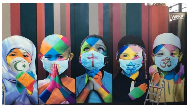
Mural de grafite do artista Eduardo Kobra, São Paulo, 2020.