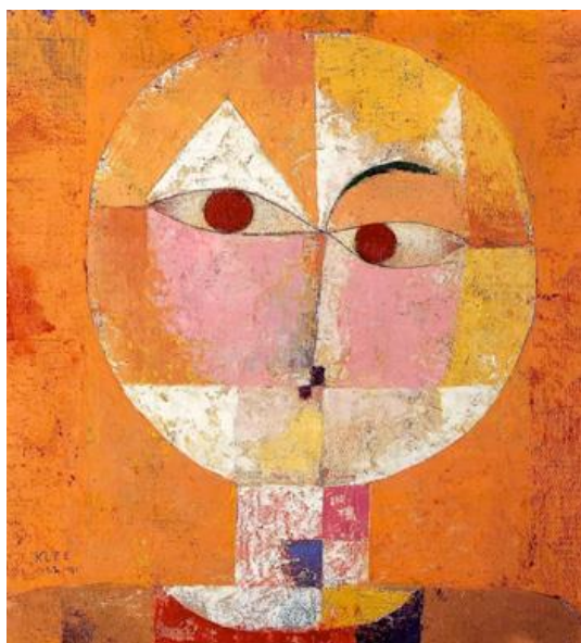
"Senecio" - Paul Klee - 1922