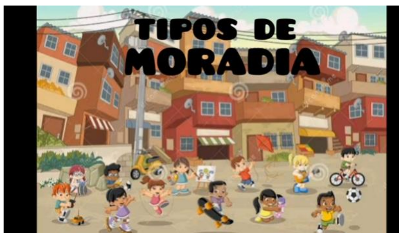
Tipos de Moradias - Educação Infantil

AGORA VAMOS ASSISTIR A UM VÍDEO PARA APRENDERMOS UM POUCO SOBRE OS DIFERENTES TIPOS DE MORADIA QUE EXISTEM. É SÓ ACESSAR O LINK ABAIXO: