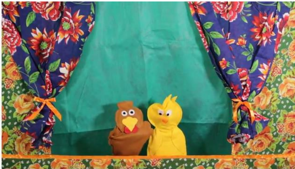
Cadê a minha mamãe - FANTOCHE

VAMOS OUVIR A HISTÓRIA "CADÊ MINHA MAMÃE"? É SÓ ACESSAR O LINK ABAIXO: