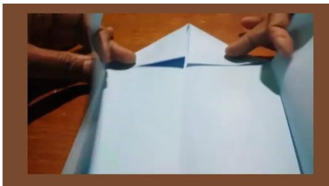
Dobradura de casa (Aula de Arte)

VAMOS FAZER UMA LINDA DOBRADURA DE CASINHA. ACOMPANHE COM ATENÇÃO O TUTORIAL A SEGUIR E DEPOIS MOSTRE AQUI NO GRUPO SUA DOBRADURA.