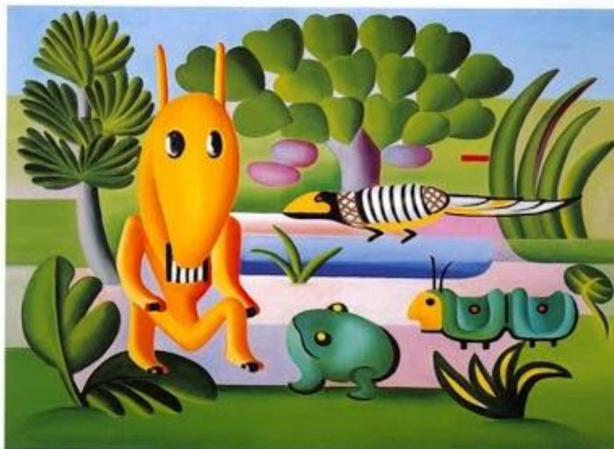
Obra "A cuca" (1924) - Artista: Tarsila do Amaral