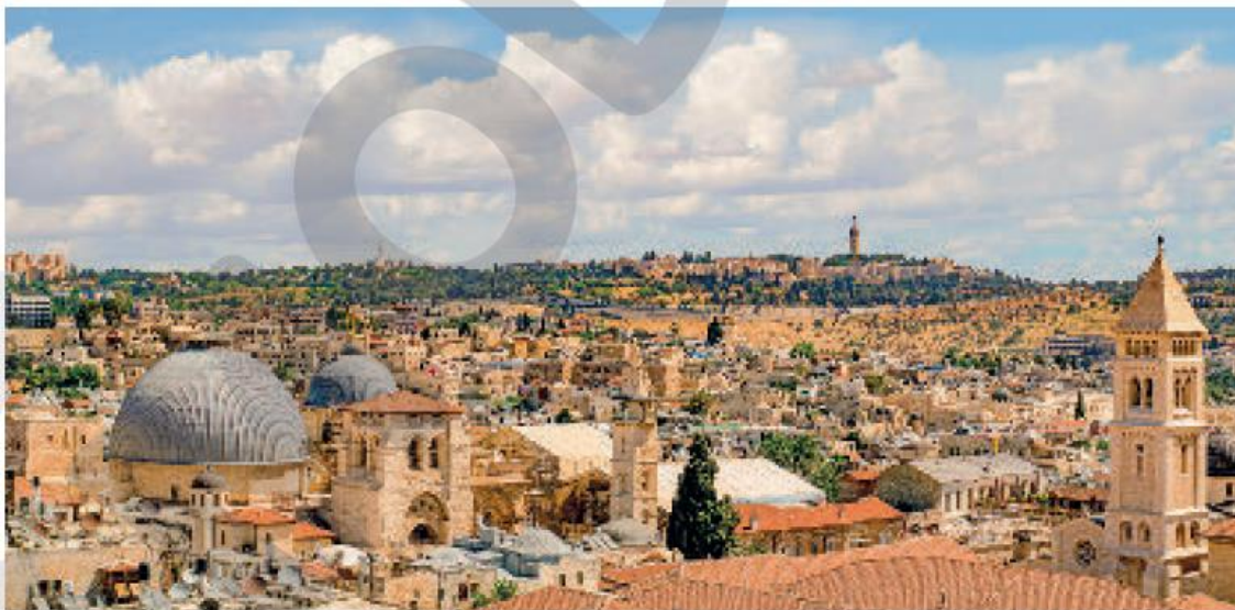
Vista panorâmica da cidade de Jerusalém, considerada sagrada por cristãos, muçulmanos e judeus. Israel, 2017.

asiático, considerado o berço das três maiores religiões do planeta: o cristianismo, o islamismo e o hinduísmo. Muitas outras religiões são praticadas no continente, como o xintoísmo, no Japão, o judaísmo, em Israel, e o budismo, na China. Existem no continente países com maior desenvolvimento, como Japão e Coréia do Sul, que apresentam economias dinâmicas, mão de obra altamente qualificada e altos níveis socioeconômicos; outros com índices altos e medianos, mas que apresentaram crescimento nas últimas décadas, como a China e os Tigres Asiáticos; e, finalmente, países com baixíssimos índices de desenvolvimento, como o Afeganistão e o Iêmen. As atividades econômicas são muito diversificadas: há a prática da agricultura de subsistência, com pouca produtividade, a presença de indústrias que empregam mão de obra barata, campos com agricultura altamente mecanizada, indústrias que empregam alta tecnologia e elevados investimentos em pesquisa e ciência.