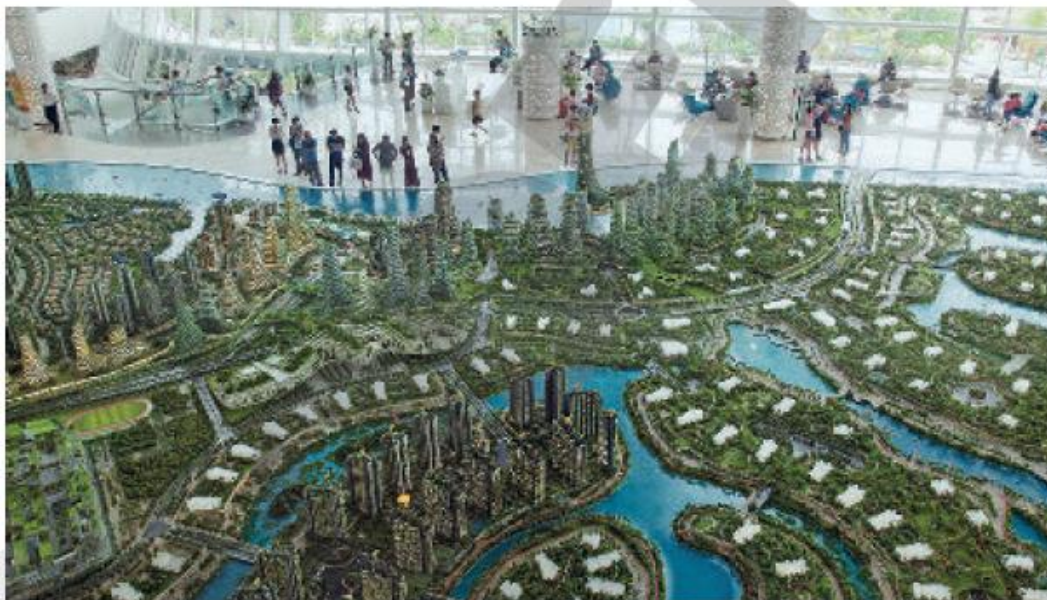
Maquete de parte de uma "cidade floresta" é apresentada em Johor Bahru, Malásia (2016).

cidade. As preocupações do governo malaio em relação ao futuro urbano não se restringem à "metrópole inteligente" de Iskandar. Além dessa cidade, estão sendo planejada "aldeias inteligentes", "cidades florestas" e "ecocidades", com casas a preços populares, escolas, hospitais e lazer, integrados pelo uso de alta tecnologia, e um sistema agrícola criativo, em circuito fechado, proporcionando alimentos e renda suplementar aos moradores dos pequenos centros urbanos. Na China, também existem projetos de concepção de cidades mais verdes e sustentáveis, como a "cidade floresta" em Liuzhou, construída para abrigar 30 mil moradores, 40 mil árvores e cerca de um milhão de plantas de espécies variadas. Essa vegetação será distribuída pelas fachadas dos prédios, a fim de melhorar a qualidade do ar, diminuir a temperatura da cidade e servir de barreira para ruídos.