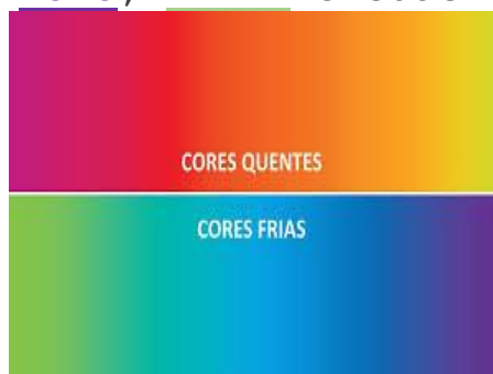
Cores em degrade