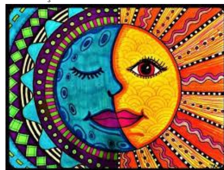
Cor Fria - Cor quente