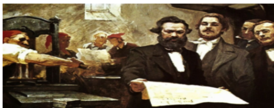
Leia o fragmento de texto dos filósofos alemães Karl Marx e Friedrich Engels.

https://www.youtube.com/watch?v=85tLMEjIy2w