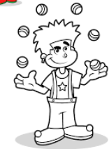
MALABARISTA ( )