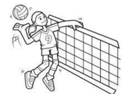
Vôlei ( )