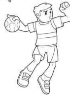
HANDEBOL ( )