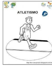
ATLETISMO ( )