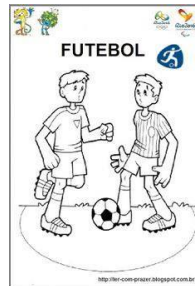
FUTEBOL ( )