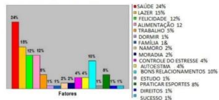
CONCEITO SOBRE QUALIDADE DE VIDA

https://www.google.com/search?q=SAUDE+E+QUALIDADE+DE+VIDA+GRAFICO&source=lnms&tbm=isch&sa=X&ved=2ahUKEwj3xNnI9pbxAhVaGbKGRVQ0bocQAUoAKoECAEQAw6biw1280&bih=813#imgre=wSMONABpIaa0CM