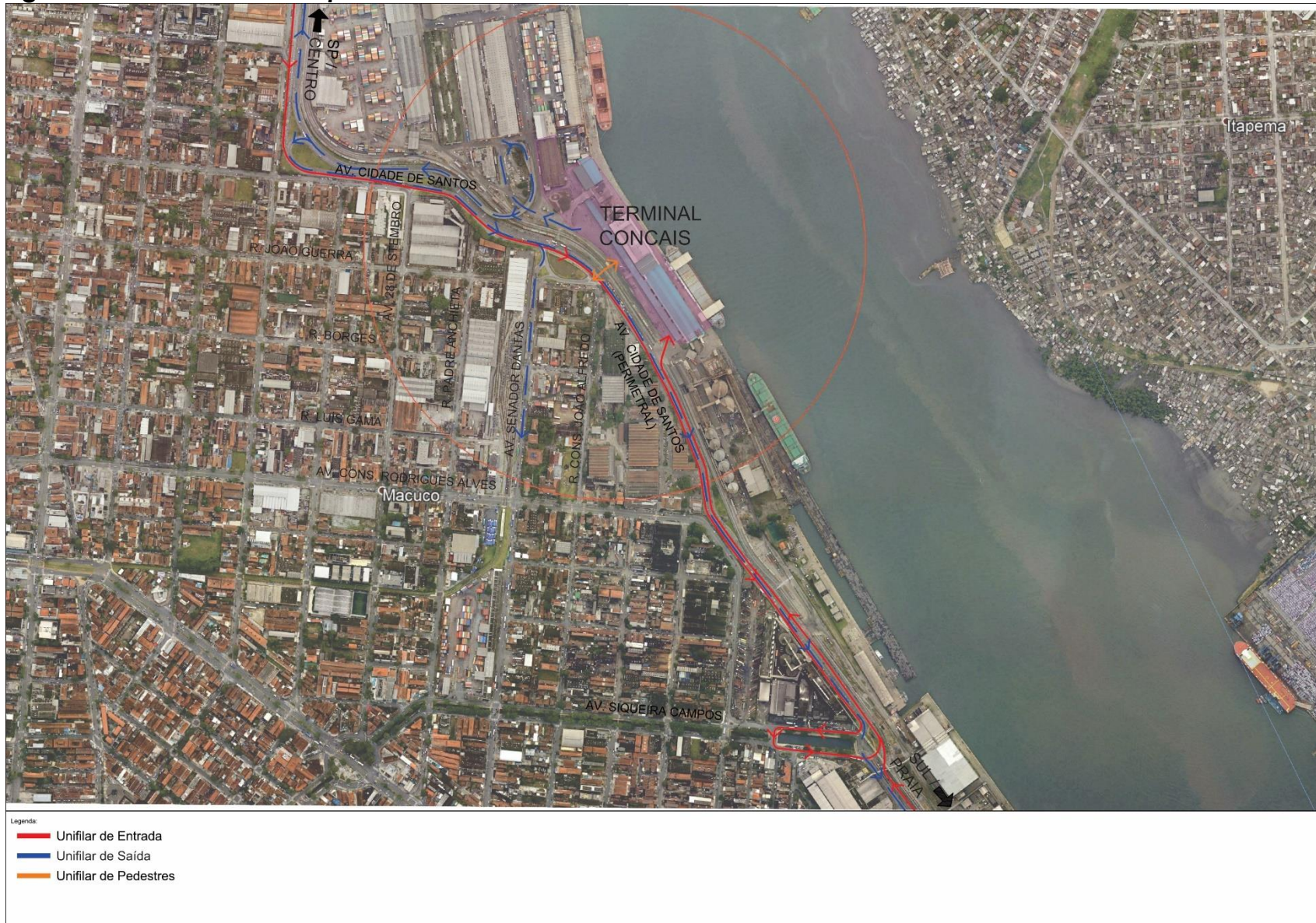
Figura 2.4 – Acessos ao Empreendimento