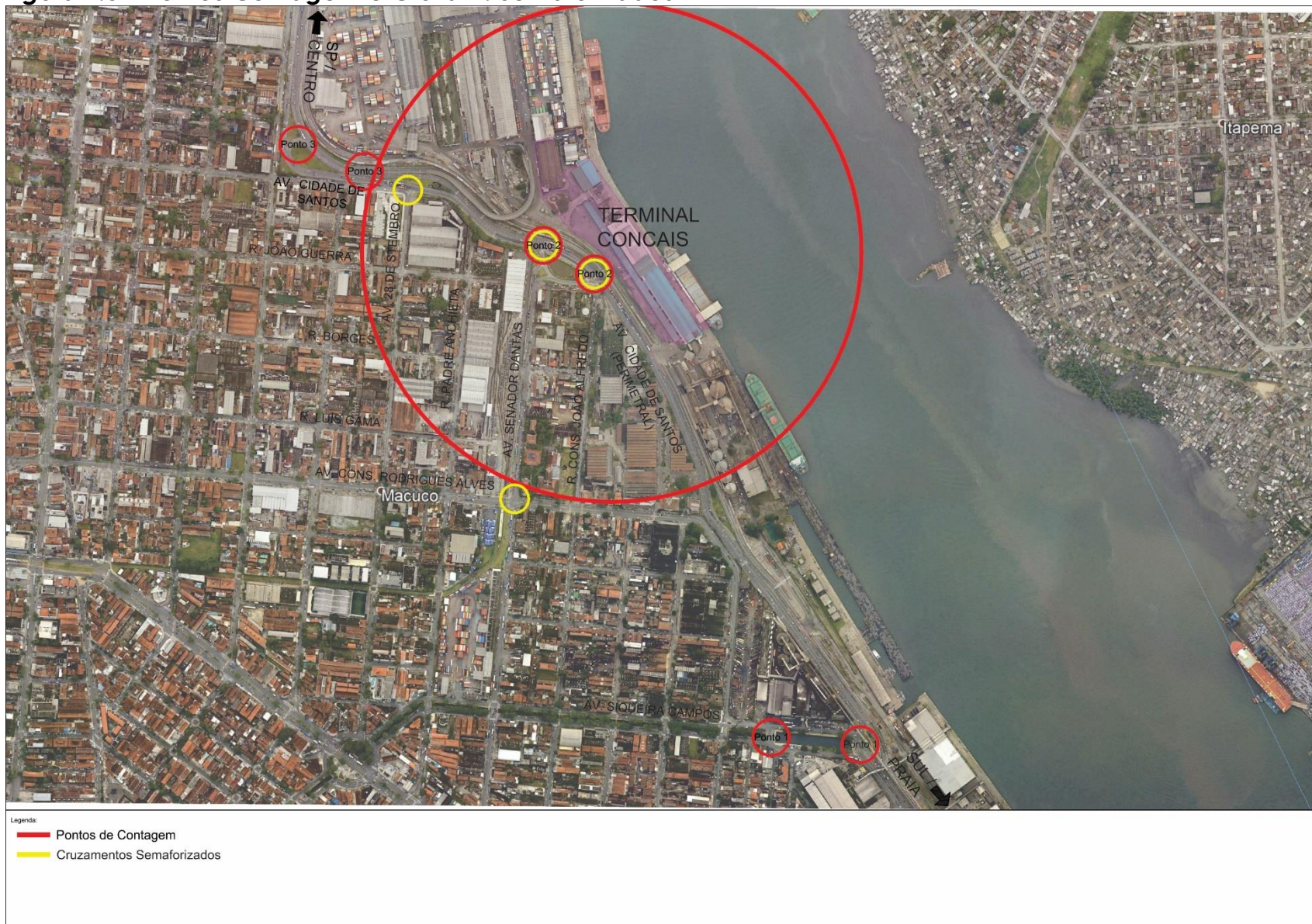
Figura 2.8 – Pontos Contagem e Cruzam. Semaforizados