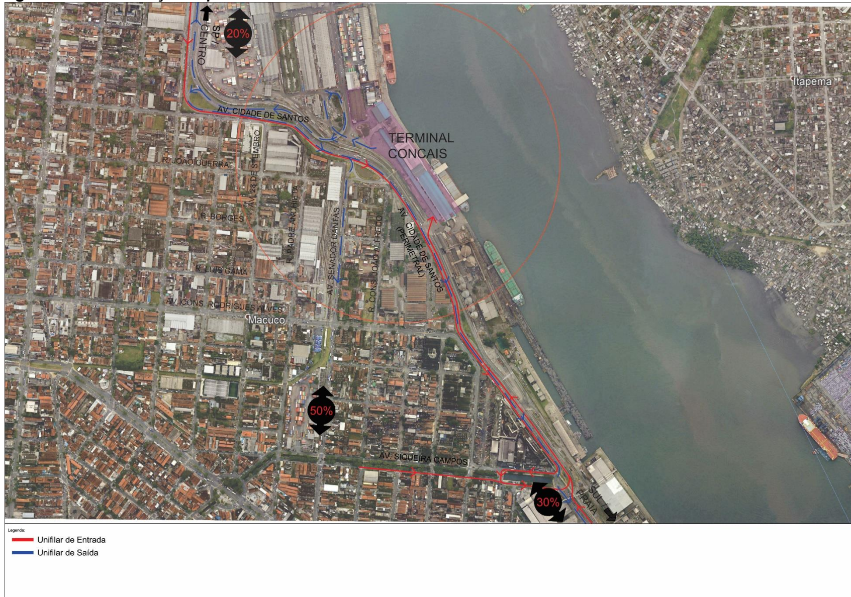
Figura 3.1 – Distribuição Espacial - FUNCIONÁRIOS