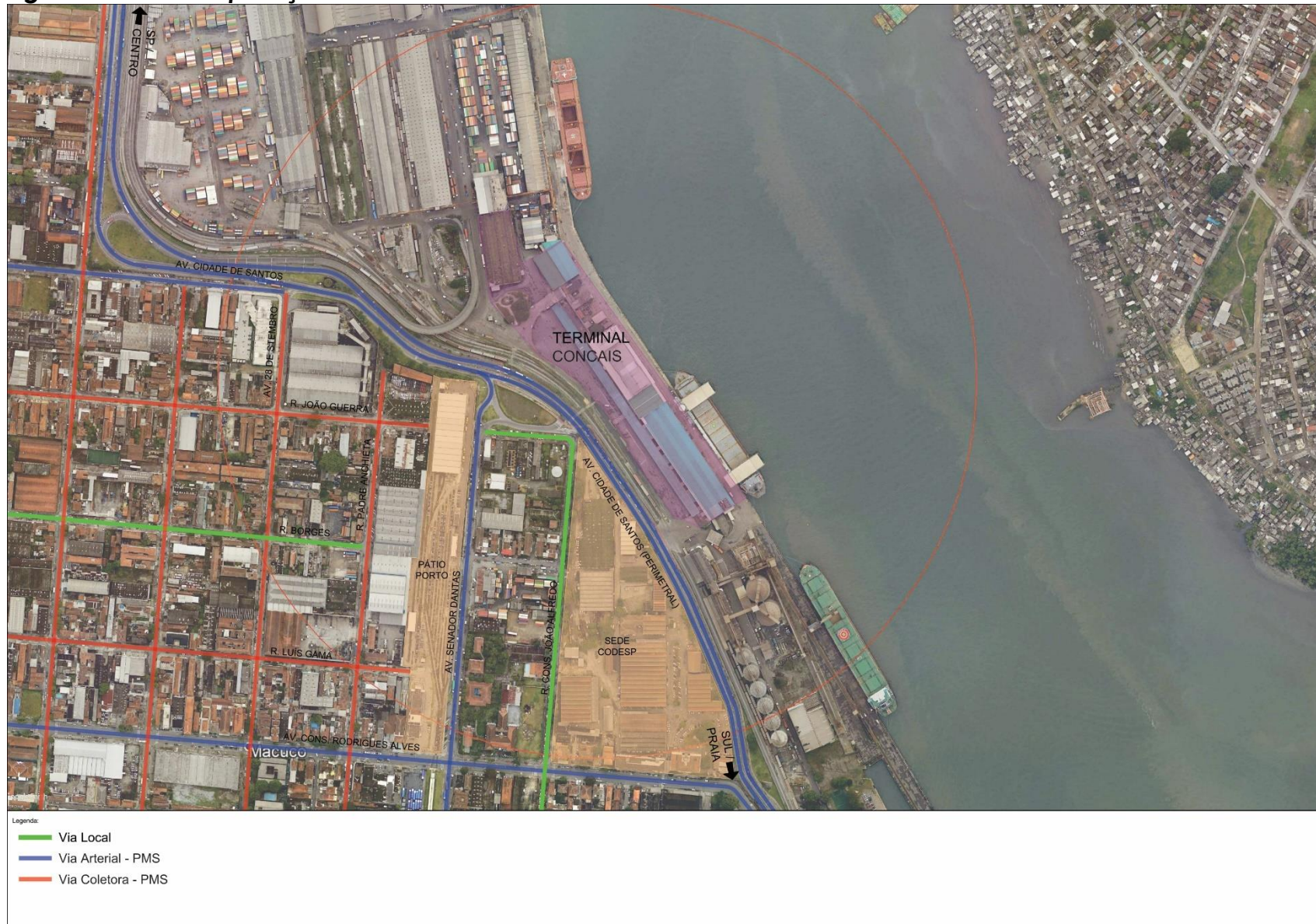
Figura 2.3 – Hierarquização Viária