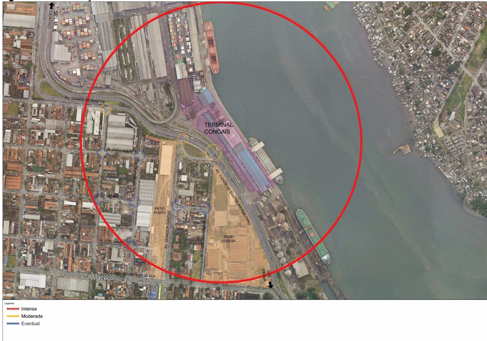
Figura 2.7 – Circulação e Travessias de Pedestres