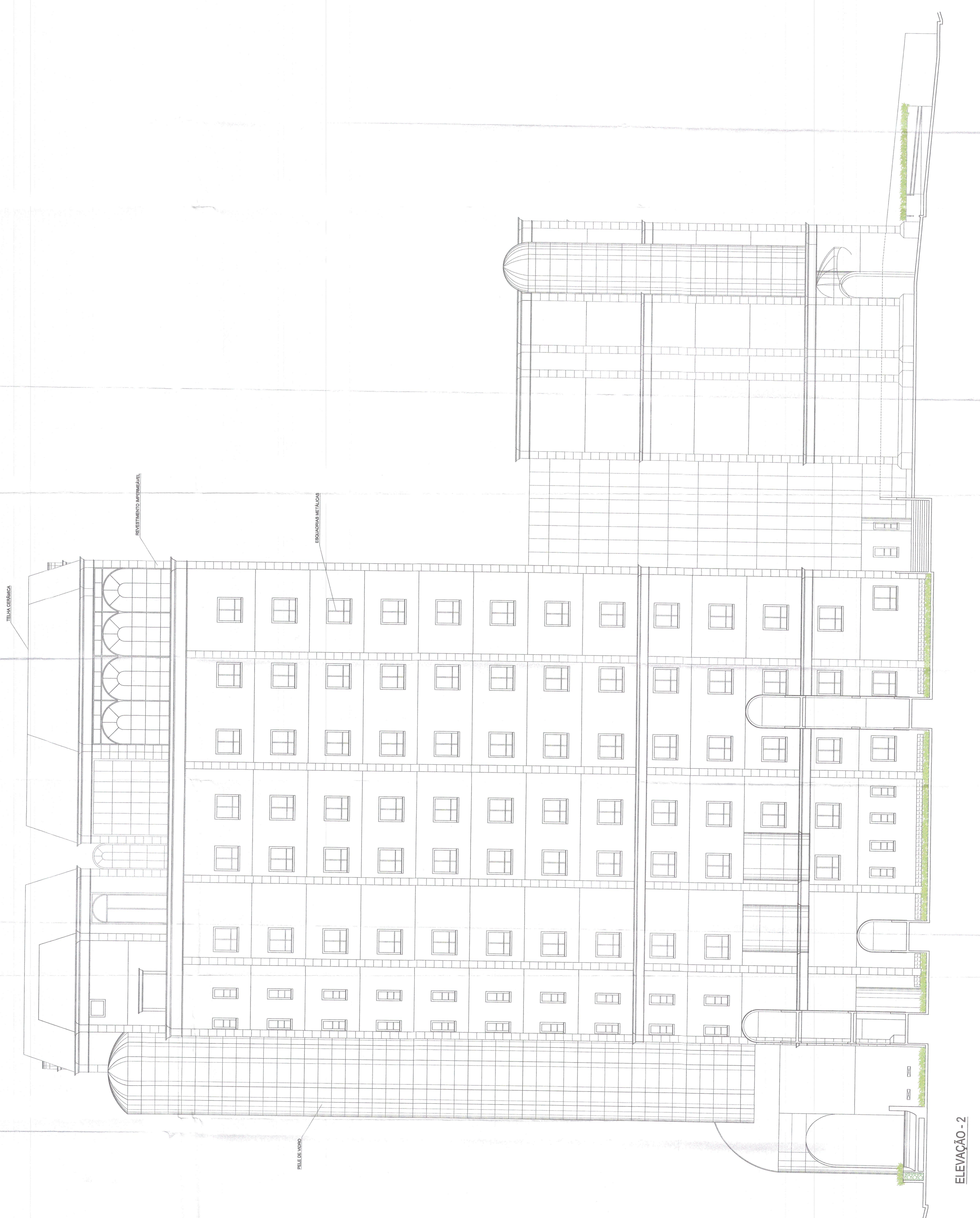
ELEVACÃO - 2