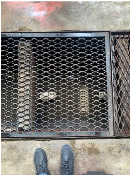
Caixa 3 - filtragem 3