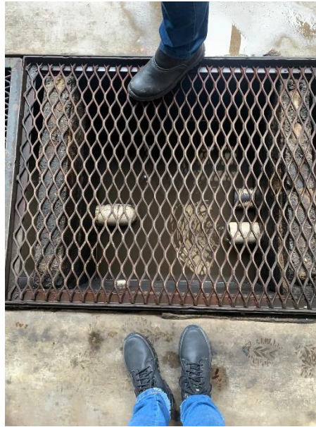
Caixa 2 - filtragem 2