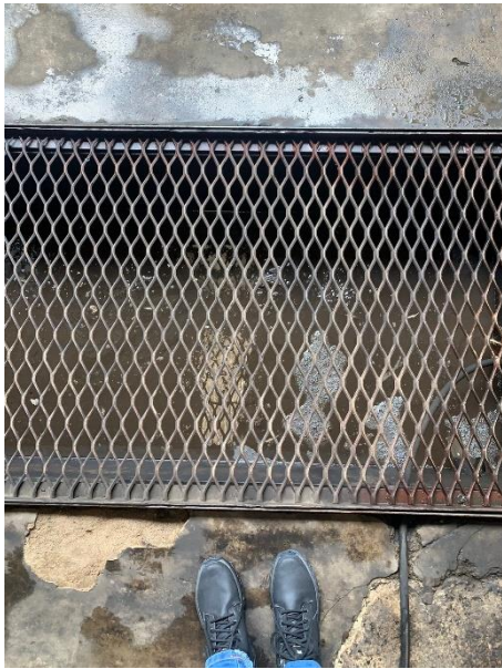
Caixa 1 – filtragem 1