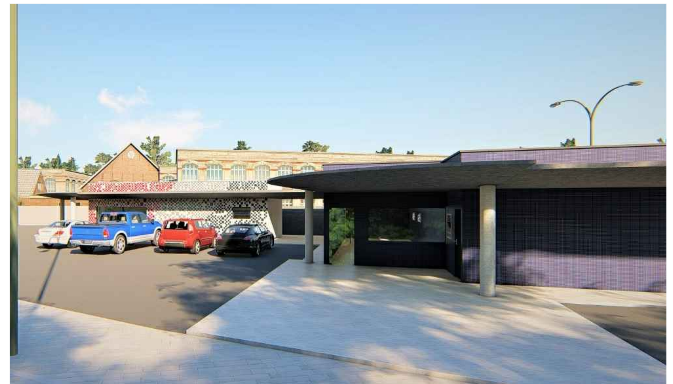
ESTUDO DE VOLUMETRIA E CORES S/ ESCALA